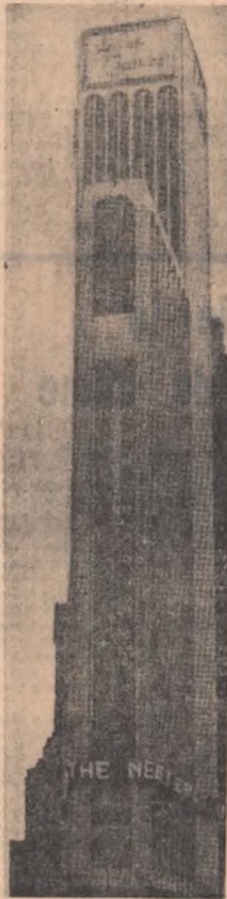
Un termometru uriaș de șase etaje înălțime instalat pe fațada clădirii Allied Chemical din Times Square (New York)

Duminică în Gabon au loc alegeri prezidențiale și legislative, cu un an înainte de termenul stabilit. Ele se vor desfășura pe baza sistemului electoral majoritar, într-un singur tur de scrutin. Vor fi aleși 47 deputați, reprezentînd cele 9 departamente ale Gabonului. De relevat că opoziția a hotărît să nu-și prezinte candidații la alegeri, mai ales din cauza faptului că principalii săi lideri s-au raliat la partidul de guvernămînt, Blocul democratic din Gabon. Hotărîrea sefului statului, Leon Mba, de a organiza înainte de termen alegerile, se afirmă în cercurile politice gaboneze, este motivată de dorința sa de a asigura stabilitate politică, mai ales în condițiile actuale cînd din motive de boală a fost necesară răminerea sa pe o perioadă la Paris. „Continuitate și stabilitate politică, iată sarcina pe care și-a stabilit-o guvernul gabonez”, a declarat președintele Mba, într-un mesaj radiotelevizat, înregistrat la Paris. Leon Mba s-a pronunțat pentru dezvoltarea economică a țării, încît Gabonul să se situeze printre statele dezvoltate.