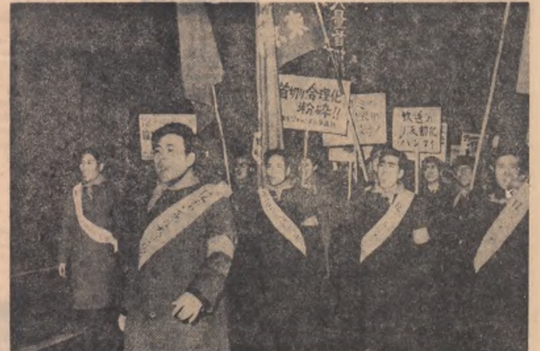
JAPONIA. Aspect de la o demonstrație a muncitorilor din Tokio, organizată în cadrul ofensivului de primăvară