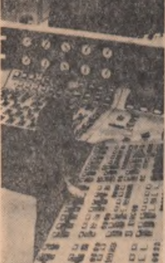
Interior de la Centrala electrică de termoficare Brazil

L-am ascultat cîntîndu-i profesorii noștri, în timpul orelor de studiu și în public. Ultima oară, în 1943, interpretînd „Im-perialul” lui Beethoven.