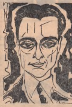
DINU LIPATTI văzut de NEAGU RADULESCU

Fiecare frază avea ponderea și locul ei bine stabilit, avea funcția ei. Fraza mergea în mod natural, iar pe primul plan nu apare virtuozitatea enormă, ci muzica. Toate aceste atribute se reflectă și în muzica sa. Interpretul, pedagogul, criticul și compozitorul Lipatti era mistuit de aceeași doritoare pasiune pentru muzică. — Pasiune care-l făcea pe Vuellermoz să scrie la moartea lui, „Muzica a rămas fără unul din cei mai admirabili apărători ai ei”. Din seria creațiilor sale ați pus desigur la loc de frunte Concertino... — Prețuiesc în egală măsură tot ce a scris Lipatti. Într-o zi poate voi interpreta în public tot ce a scris pentru pian și aș fi bucuros să putem asculta în