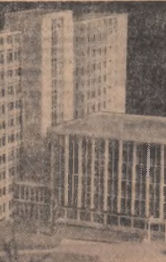
Macheta noului spital de pediatrie din Oradea. Spitalul de pediatrie aflat în construcție va avea o capacitate de 400 paturi pentru copii, 80 pentru mame însoțitoare și 20 pentru reanimare

Totagiu de pribegie și aarica în care-și strînsese avuțul său de preț, do-vezile dreptului românesc al Ardealului, l-au înso-țit pe Badea Cîrjan în misionarismul său patri-otic, hăituit ori de ironia