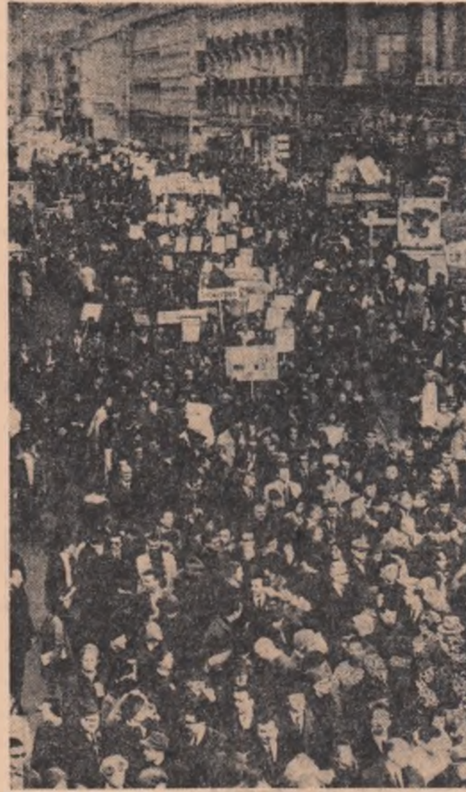
BELGIA — În piața Broeckere din Bruxelles circa 8.000 de persoane au demonstrat împotriva intervenției S. U. A. în Vietnam

În noaptea de 15 spre 16 martie majoritatea membrilor cabinetului columbian au fost chemați de urgență de președintele Republicii. Mulți dintre ei au crescut în primul moment că e vorba de o lovitură de stat. Temerile s-au vădit însă a fi nejustificate. Președintele Lleras Restrepo îl convocase la o reuniune extraordinară. Reuniunea care s-a încheiat în dimineața de 17 martie la orele 6.