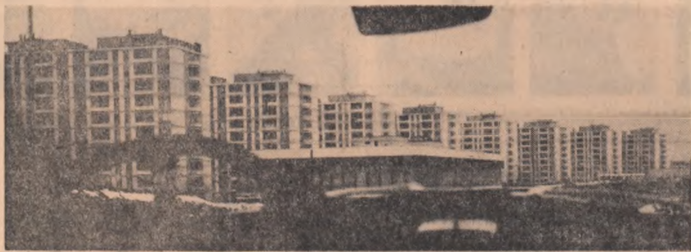
Imagine din Orașul Gheorghiu-Dej