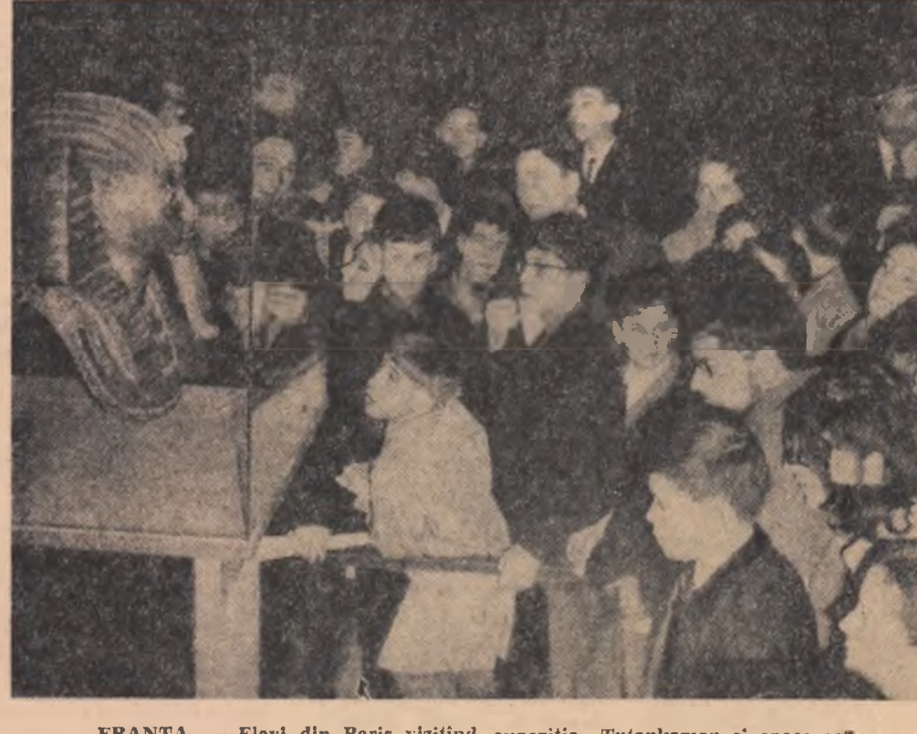
FRANȚA — Elevi din Paris vizitînd expoziția „Tutankamon și epoca sa”

INTR-O scrisoare adresată fostului guvernator al statului Guanabara, Carlos Lacerda, fostul președinte al Braziliei, Juscelino Kubitschek, s-a declarat în favoarea creării, în limitele legislației actuale braziliene, a unui nou partid politic „de opoziție”. Acesta ar urma, după cum menționează agenția France Presse, să adopte față de guvern