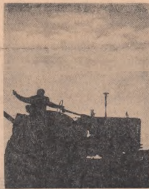
În zori, spre ogoare.

CAMPANIA AGRICOLĂ DE PRIMĂVARĂ ÎN REGIUNEA BACĂU