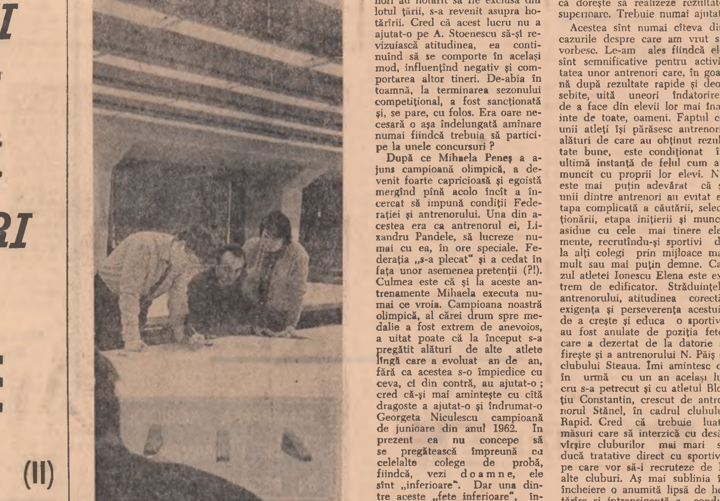
Institutul de cercetare și proiectare pentru construcții navale — Galați. În fotografie: Pe masa de trasaj foto-optic se află un nou tip de cargou de 4500 tone

„Drumul înseamnă, de fapt, două drumuri alăturate”