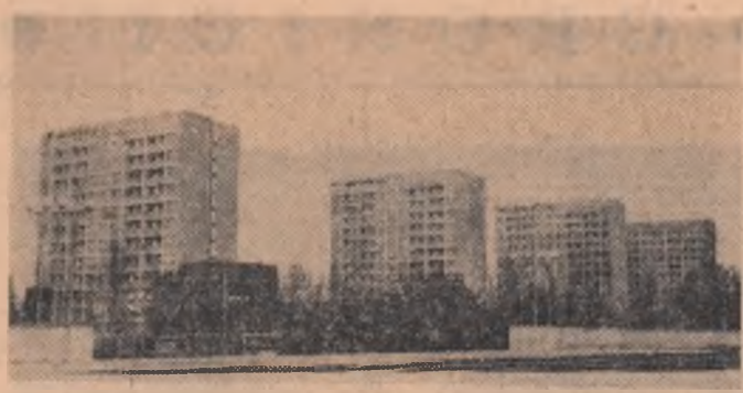
Pe B-dul Muncii din Capitală.