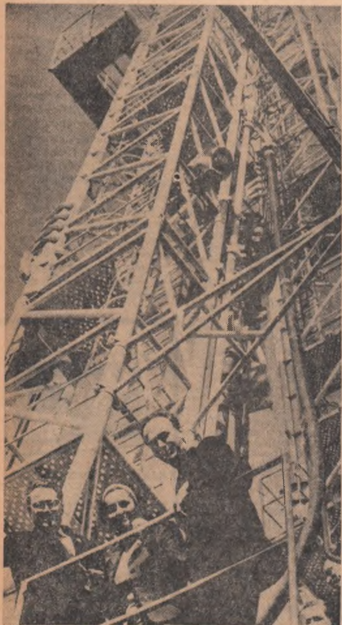
După cum s-a anunțat, la Târgul de primăvară de la Leipzig, instalația de forare F-200, construită în România a obținut medalia de aur. În fotografie: imagine a turlei acestei instalații