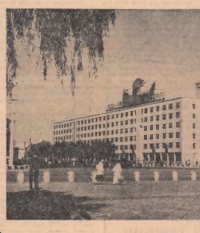
R. P. D. COREANĂ. Vedere din Phenian.