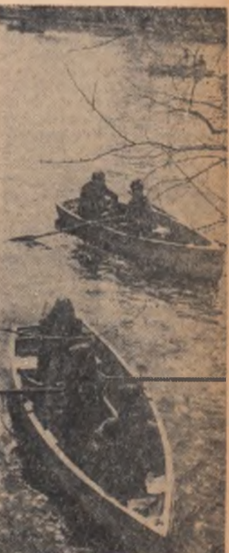
Primăvara în Gișmigiu