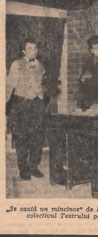
„Se caută un mincinos” de Dimitrie Psathas, interpretat de colectivul Teatrului popular din Turnu Severin