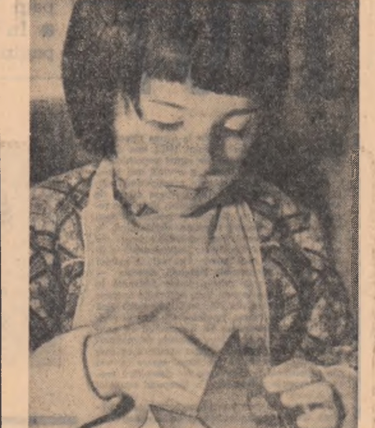
Răsfoind primele pagini...

DEVA (de la corespondentul nostru). După îndelungi studii și cercetări, specialiștii Institutului de cercetări pentru securitatea minieră din Petroșani au descoperit o metodă eficientă de prevenire a autoaprinderii cărbunilor la exploatarea minieră Lunea. Metoda constă în stropirea pereților și injectarea în stratul de cărbune a unei soluții apoase de clorură de calciu și argilă care oprește pătrunderea aerului în strat și duce la scăderea temperaturii în abataje. Utilizarea acestei metode va duce la creșterea productivității și la întărirea securității muncii.