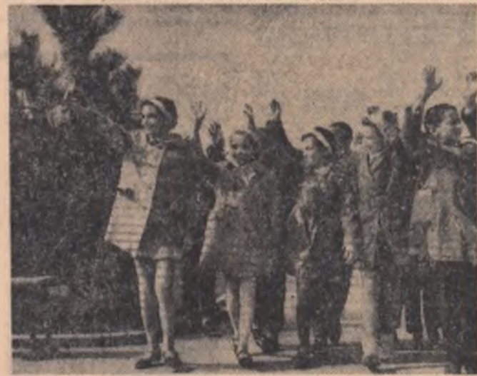
Plimbări de vacanță...