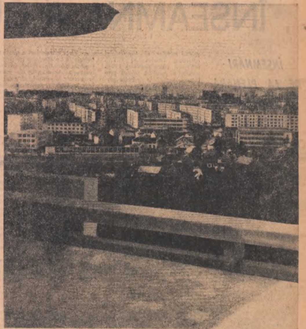
Construcții noi în orașul Suceava