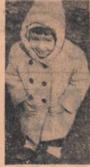
Bau-bau, tătucule!