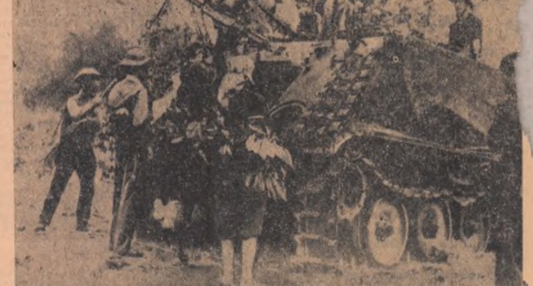
Imagine din timpul tulburărilor care au avut loc în Sierra Leone

tre guvern și o companie de aviație). Această însemnă că guvernul britanic va face o anchetă privind contractele încheiate de ministerele aviației cu firme particulare. Această hotărâre a fost luată după ce au fost dezvăluite public, sursele profiturilor uriașe ale întreprinderilor „Siddeley” din Bristol („Bristol Siddeley Engines”). În urma investigațiilor de acum câteva zile s-a constatat că „Bristol Siddeley Engines”, obținuse „profituri excesive” din contracte cu statul în perioada 1959—1963. În această perioadă, contractele încheiate cu firma respectivă pentru repararea eliozavei zece de aparate de zbor Viper și Sapphire erau în valoare de 16.500.000 lire, calculate pe baza unui „preț fix” (tip obișnuit de contract in-