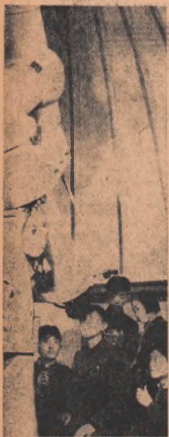
R. P. D. COREEANĂ : Elevi în vizită la observatorul astronomic din Phenian

● ZIARUL „Ultimas Noticias” a publicat o știre în care informează că în apropiere de localitatea Mezcala (Statul Guerrero) s-a prăbușit un obiect de formă cilindrică, de mărimea unui autobuz. Un trimis special al ziarului a interogat numeroși localnici, care au confirmat că obiectul avea forma unui trabuc și au declarat că au auzit zgomotul produs de prăbușirea lui. El au specificat că în cădere obiectul a emanat o lumină orbitoră, imposibil de a fi confundată cu cea emisă de un meteorit. O unitate de infanterie a fost trimisă la fața locului pentru a stabili punctul unde obiectul a atins suprafața pământului și natura acestuia.