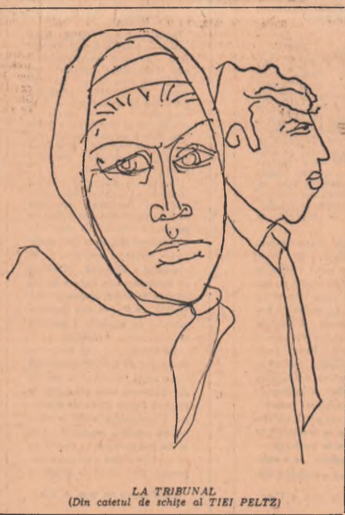
LA TRIBUNAL (Din caietul de schițe al TIEI PELTZ)