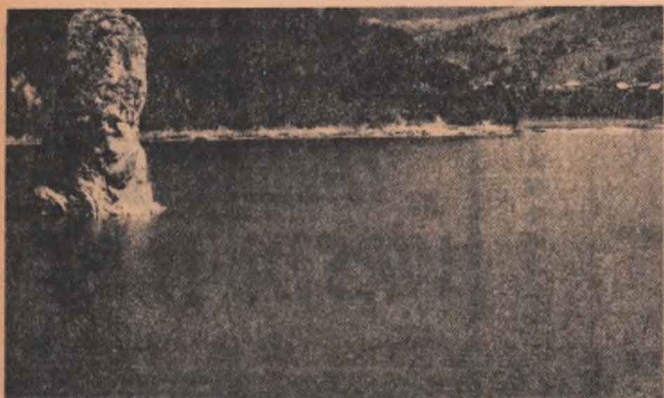
Plata tetului (Lacul de acumulare Bicaz)