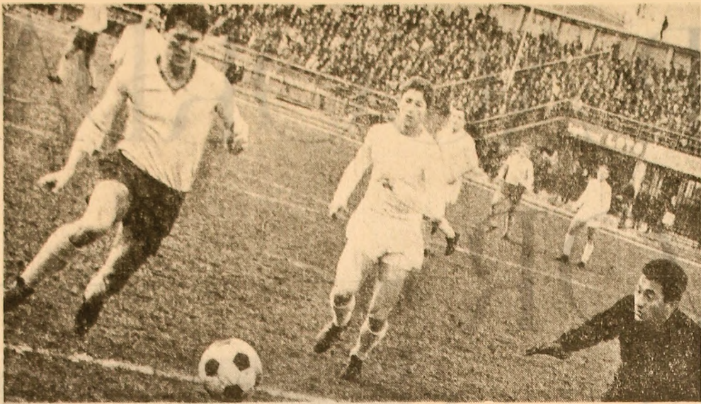
În meciul de fotbal de duminică, de pe Republicii, dintre echipele Dinamo și Petrolul, asemenea duelului între înaintași și portari, ca cel din imaginea de față, au fost destul de frecvente. Ele au încântat publicul în fața de desfășurare, dar, după consumarea lor, spectatori au rămas dezamăgiți de lipsa de eficacitate a ambelor înaintași care au trosit numeroase ocazii de gol.