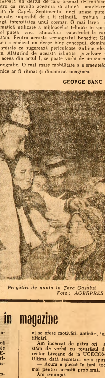
Pregatiri de nunta in Tara Oasului