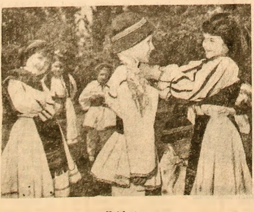
Hal la joc...

Nimic mai omeneș să al „apetiiți culinare” în nu sînt ce situații speciale. De exemplu, într-o situație ca aceasta înfrîmplată acum două zile. Mal erau ctive minute pînă la trenul cu care trebuia să plec. O foame omenească se cerea răsplătită. In Gara de Nord, aglomerație excesivă. Deci, peste drum, la bufetul expres, mare ct un hanzar. O privire scrutătoare prlo galantarele de dincolo de geamurile cam opace prin neapălare și lată „obiectul” căutat: fasolea cu cîrșaf. Nimic mai simplu dect: coadă la casă, achiziții frumos, cale-rița uită să-ți dea rest de 10 bani, (mă rog, și „ultarea-i scriă-n legile omenești”, e