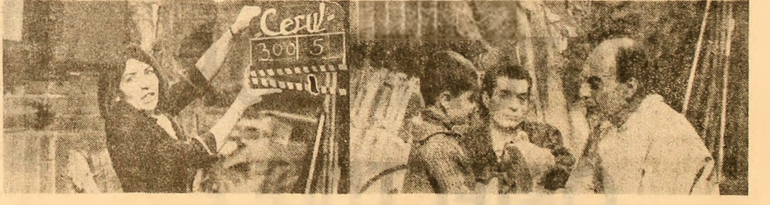
Pe platourile de la Buftea se filmează „Cerul începe la etajul 3” după Francisc Munteanu.