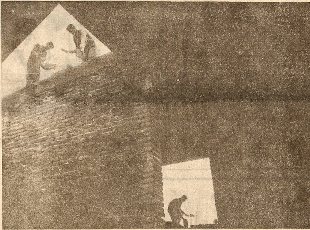
Oamenii numesc ferestrele — ochii caselor