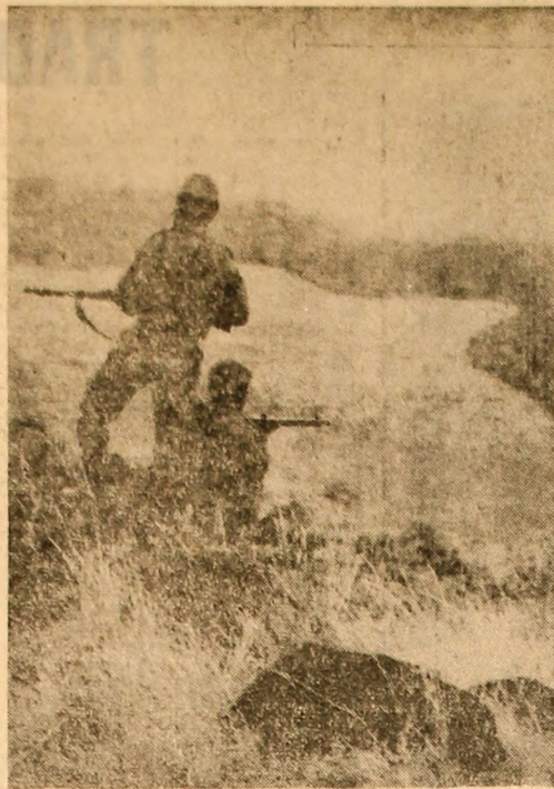
ANGOLA: Luptători ai forțelor patriotice într-o misiune de recunoaștere

„Desigur nu este vorba de perspective de pace”. Deși domnul Rusk a vorbit, deseori în cursul reuniunii despre prelușele „intenții de pace” ale S.U.A., rostind ostentativ fraze în care eburnău cuvintele „pace”, „soluție negociată”, orientarea Washingtonului rămîne extrem de agresivă. Autorii politicii americane nu desprind concluzii realiste din eşecurile de pînă acum, intensificînd intervenția împotriva poporului vietnamez. Bombardarea orașului Haifong, întreprinsă în cea-