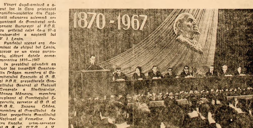
Vineri după-amiază a avut loc la Casa prieteniei româno-sovietice din Capitală adunarea solemnă organizată de Comitetul orașului București al P.C.R. cu prilejul celei de-a 97-a aniversări a nașterii lui V. I. Lenin.

A luat apoi cuvântul tovarșul Manea Mănescu, care a vorbit despre cea de-a 97-a aniversare a nașterii lui V. I. Lenin.