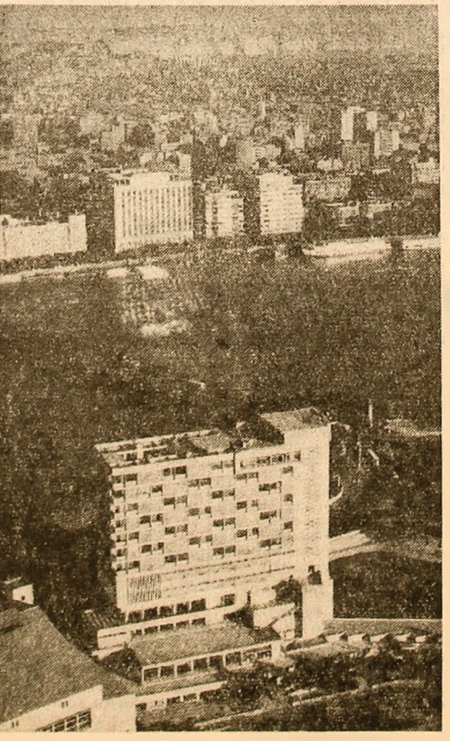
R.A.U. Imagine din Cairo