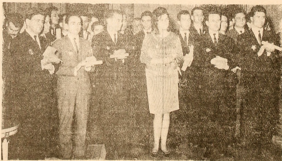
În timpul solemnității decorării la Consiliul de Stat