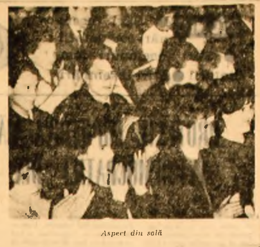
Aspect din sală