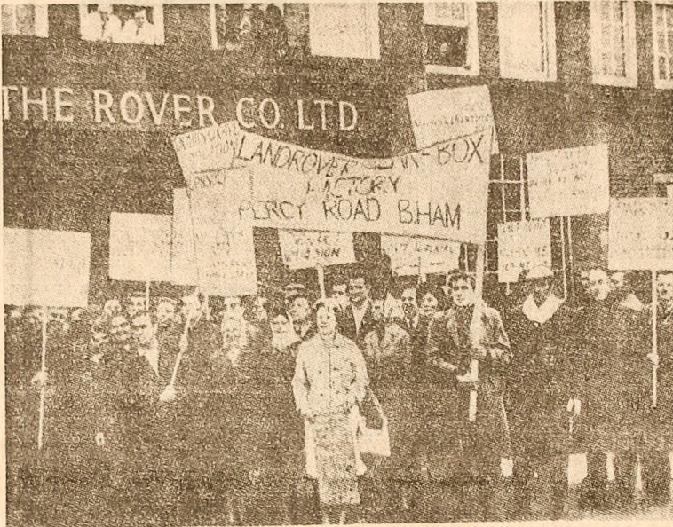
ANGLIA. Demonstrație pe străzile orașului Birmingham împotriva politicii de austeritate a guvernului laburist

Pe de altă parte, președintele Adunării Generale a O.N.U., Abdul Rahman Pazhwak (Afghanistan), a anunțat că Comitetul pentru Tutela al O.N.U., în care au reprezentat toate țările membre ale O.N.U., va proceda săptămîna viitoare la audierea unor petiționari din teritoriul Africii de sud-vest. Pe perioada cit vor dura aceste audieri, lucrările Adunării Generale a O.N.U. consacrate problemei Africii de sud-vest vor fi suspendate.