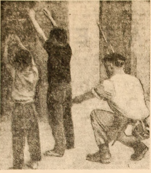
ADEN. — Aspect din timpul unei acțiuni represive a militarilor britanici