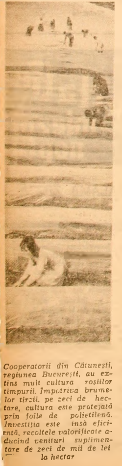
Cooperatorii din Cătușeni, regiunea București, au extins mult cultura roșilor timpurii. Impotriva brumei și zăpezii, pe zeci de hectare, cultura este protejată prin foile de polietilenă.