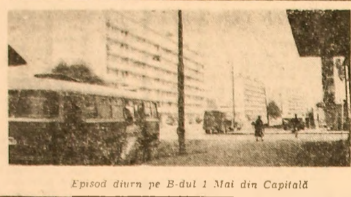
Episod diurn pe B-dul 1 Mai din Capitală