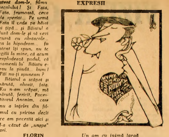
Un om cu inimă largă Desen de N. CLAUDIU

TELEVIZIUNE SIMBĂȚA 17 Iunie 1966 18,00: Pentru noi femeile; 18,30: „Preludiu la vacanță”;