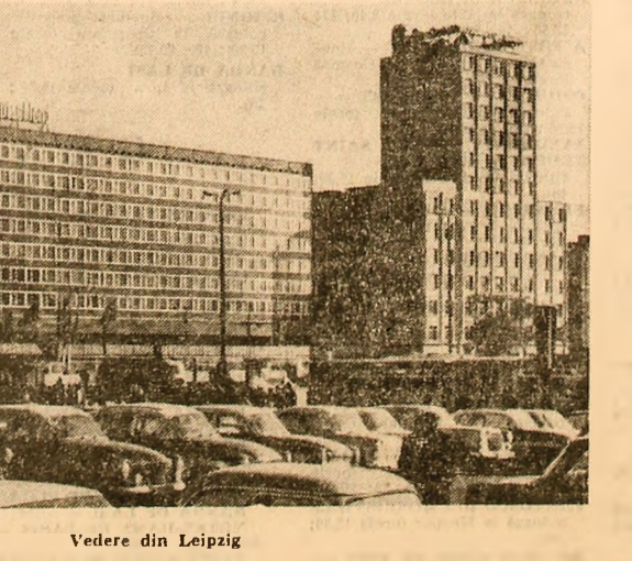
Vedere din Leipzig

La Tokio a avut loc miercuri o conferință de presă a primului ministru ceylonez, Dudley Senanayake, care întreprinde o vizită oficială în Japonia. Vorbind despre întrevederile pe care le-a avut cu ministrul japonez de externe, Takeo Miki și cu ministrul de finanțe, Mikio Mitsu, el a precizat că acestea au prilejuit o reexaminare a relațiilor economice dintre cele două țări. Referindu-se la o serie de aspecte ale evoluției situației internaționale, primul ministru ceylonez a declarat, potrivit agenției Associated Press, că una din cele mai importante condiții pentru crearea unei atmosfere în care să se poată examina reglementarea problemei vietnameze, este „ca Statele Unite să înceteze bombardamentele efectuate asupra Republicii Democrate Vietnam”.