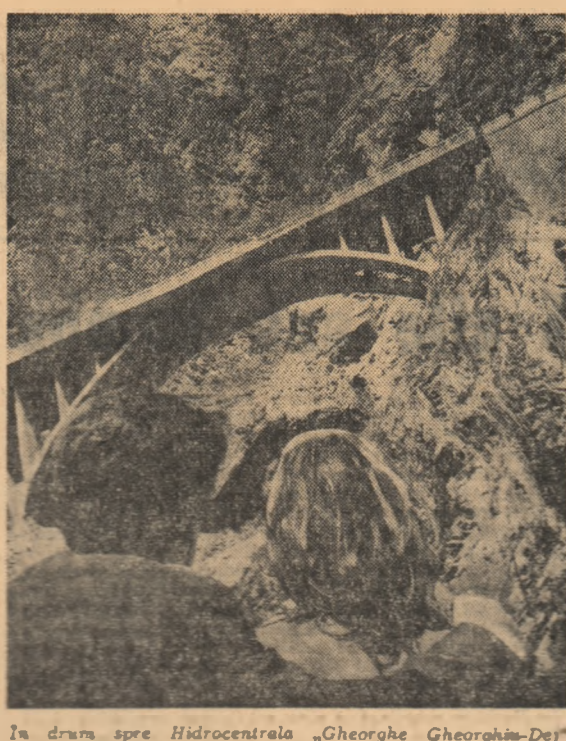
În drum spre Hidrocentrula „Gheorghe Gheorghiu-Dej“ de pe Argeș