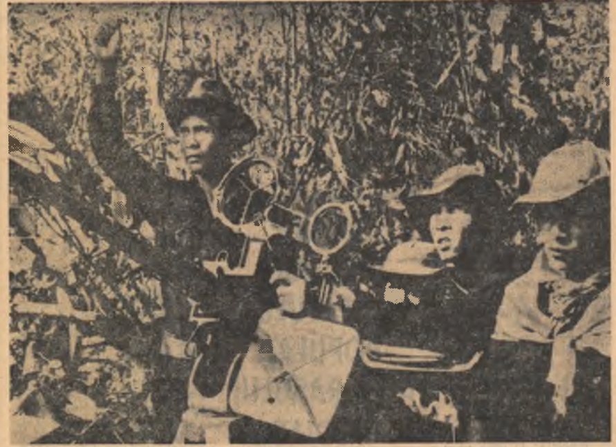
VIETNAMUL DE SUD: Unitate antiaeriană a forțelor patriotice, care s-a distins prin doborârea unui mare număr de avioane americane.

ADRIAN IONESCU correspondentul Agerpres la Hanoi