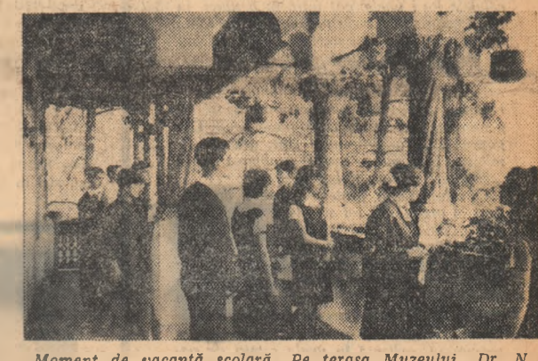
Moment de vacanță școlară. Pe terasa Muzeului „Dr. N. Minovici” din Capitală