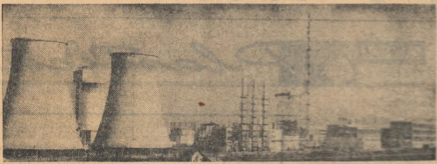
Combinatul de îngrășăminte azotoase din Tg. Mureș (vedere generală).

Chimia. În prezent aproape nu există domeniu de activitate în care, într-un fel sau altul, să nu-și facă simțită prezența. Pornindu-se de la variatele necesități ale economiei în vederea valorificării superioare a resurselor de materii prime existente, în anii construcției socialiste au apărut pe tot cuprinsul țării mari combinate, fabrici, institute de cercetări și proiectări. Chimia a cunoscut în această perioadă unul din cele mai ridicate ritmuri de dezvoltare. Oamenii muncii care lucrează în acest domeniu important al economiei naționale traspun cu consecvență în practică politica partidului consistenți de influență binefăcătoare a chimiei pentru satisfacerea nevoilor agriculturii cu îngrășăminte, biostimulatori și