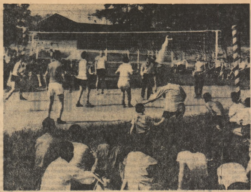
Spartachiada taberei este după cum se poate constata și vizual în plină desfășurare