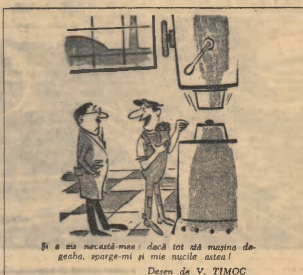
Și e zis necastă-mea dacă tot sînt mașina de geaba, sarge-mi și mie nucile astea! Desen de V. TIMOC