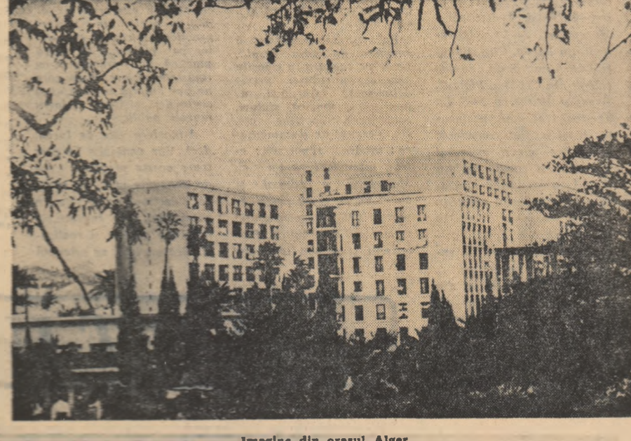
Imagine din orașul Alger

LA 3 iulie, într-un pavilion din Parcul Sokolski din Moscova s-a deschis Expoziția Internațională „Cartea” — promotor al ideilor marelui Octombrie, păcii și progresului”. Organizată în cinstea celei de-a 50-a aniversări a Marii Revoluții Socialiste din Octombrie.