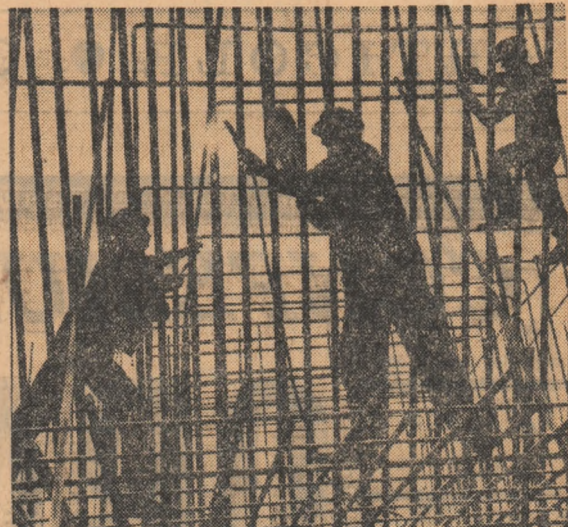
Porțile de Fier. (Se lucrează la armătura metalică de la barajul uzină).