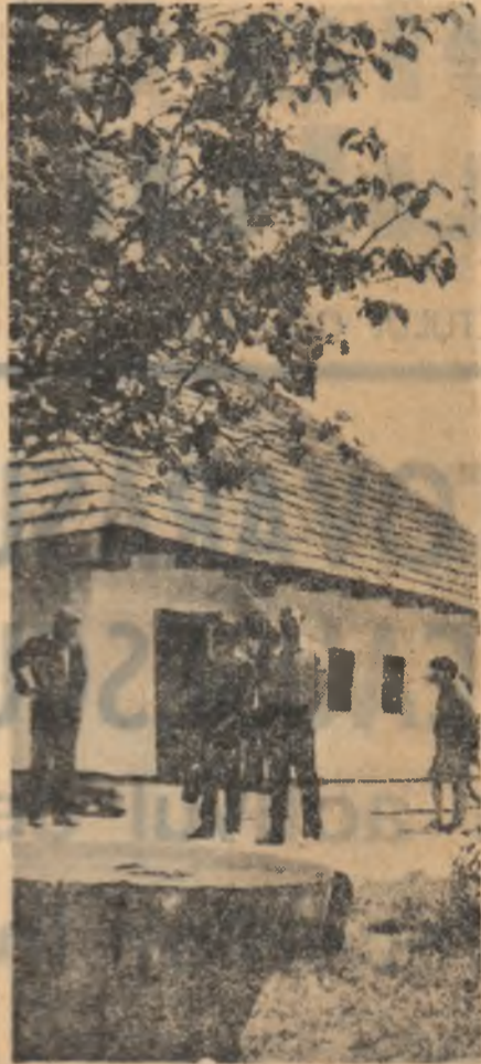
Ambianță rurală; curtea lui Creangă din Humulești