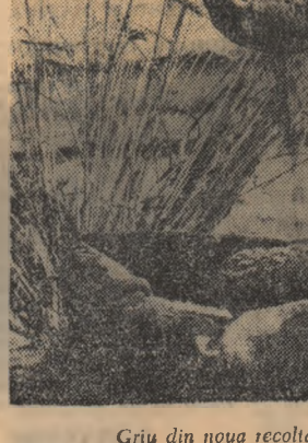
Griul din noua recoltă

Primit cu puternice și vii aplauze, a luat cuvîntul tovarășul Nicolae Ceaușescu, secretar general al Comitetului Central al Partidului Comunist Român.