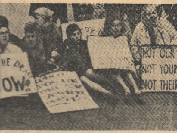
S.U.A. Pictet de femei în fața unui centru de recrutare din New York protestînd împotriva trimiterii fiilor lor în Vietnam.