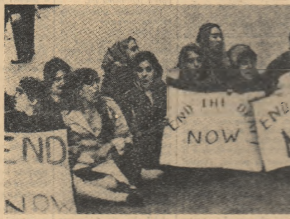
S.U.A. Pictet de femei în fața unui centru de recrutare din New York protestînd împotriva trimiterii fiilor lor în Vietnam.

REACȚIA locuitorilor din Marzabotto — fiii, frații, nepoții celor asasinati în urmă cu două decenii — a fost demnă, viguroasă. În sala cinematografului „Moderno” din mica localitate s-a desfășurat un veritabil referendum. S-a dat citire scrisorilor lui Reder.