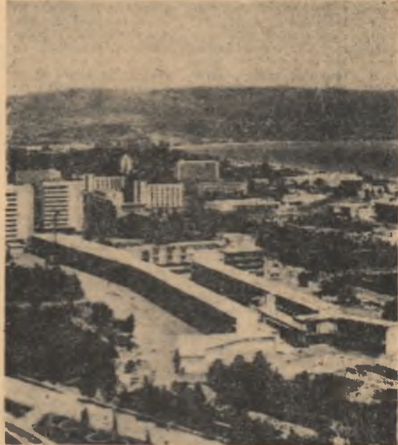
R. P. BULGARIA. Noi construcții în apropiere de Burgas

În acest timp, în țară sporește nemulțumirea populației împotriva încercării lui Ojukwu de a sfărâma unitatea statului nigerian. După cum menționează agenția U.P.I., Congresul nigerian al sindicatelor a anunțat duminică întreaga sa adunare la lupta generalului Gowon pentru a asigura unitatea și stabilitatea țării. Fenomenul se petrece și în exterior, tot mai multe țări africane condamnăm acțiunea separatistă a lui Ojukwu. Președintele Republicii Mali, Modibo Keite, menționează agenția citată, i-a transmis duminică un mesaj generalului Gowon, asigurându-l de întregul său sprijin în lupta pentru consolidarea „unei singure Nigerii”.