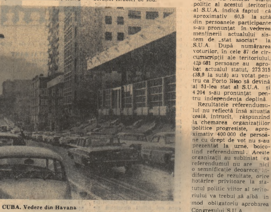
CUBA. Vedere din Havana

INALTUL comisar britanic în Aden, Humphrey Trevelyan, a sosit la Londra în vederea unor consultări cu ministrul afacerilor externe George Brown. După aceste întrevederi, Humphrey Trevelyan va pleca la New York, ca invitat al „misuniunii O.N.U. pentru Aden”. Cu acest prilej vor avea loc discuții asupra viitorului politic al Federației Arabice de sud.