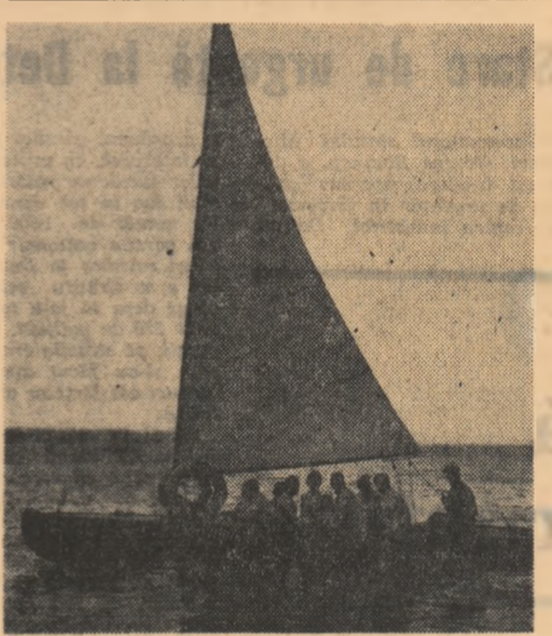
Bimbaș cu iola la Mangalia