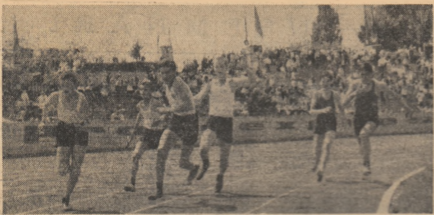
Tinerete pe stadion

Tinara generatie a Romaniei socialiste aproba din toata inima politica partidului si guvernului in domeniul relatiilor internationale