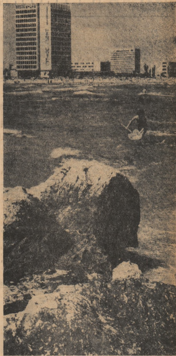
Mamaia, „Perla” litoralului

REZOLUȚIA CONFERINȚEI PE ȚARĂ A MIȘCĂRII SPORTIVE