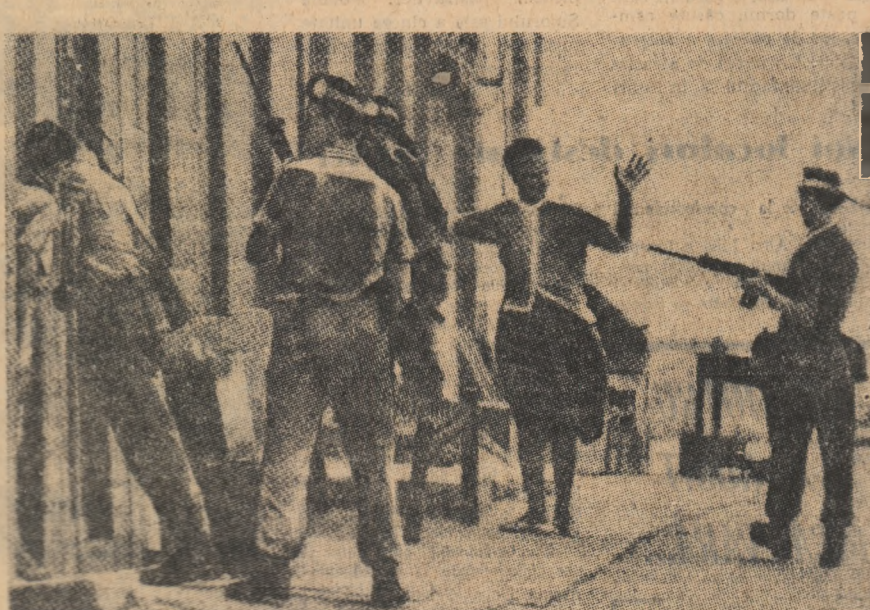
În Aden, în aceste zile, trupele britanice percheziționează pe locuitorii cartierului Crater

Comunitate de vederi între Iran, Turcia și Pakistan — anunță surse oficiale Convorbirile tripartite de la Ramsar, la care au participat președintele Pakistanului, Ayub Khan, șeful Iranului, Mohammad Reza Pahlavi, primul ministru al Turciei, Suleyman Demirel, primul ministru al Iranului, Amir Abbas Hoveyda precum și miniștrii de externe din cele trei țări, au luat sfîrșit luni. În cadrul discuțiilor, desfășurate cu ușile închise, au fost abordate o serie de probleme referitoare la situația din Orientul Apropiat și în mod special la coordonarea poliției de dezvoltare economică a celor trei țări. Referindu-se la rezultatele convorbirilor, surse oficiale iraniene au menționat că există o comunitate de vederi între Iran, Turcia și Pakistan în legătură cu problemele discutate.