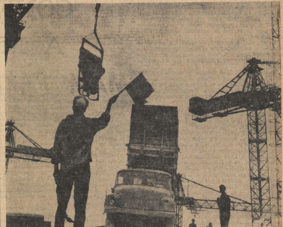
Oameni, macarale uriașe, zeci de basculante așează metru cu metru fundamentul de beton al cîntoarei centrale hidroelectrice de la Porțile de Fier

Un spectacol în aer liber este o noțiune foarte largă. Un spectacol al cărui plan și cerul, dar cu o piesă istorică pune problema ambianței. Scoaterea piesei de pe scenă și montarea ei între niște ziduri vechi e de presupus că se face datorită unei adevărate maxime în care vechile ziduri reclamă de la sine montarea piesei aici. Așa stau lucrurile cu Viforul lui Delavrancea, adaptat de teatrul botoșănean chiar ruinelor cetății Suceava unde se și petrece acțiunea. Luceafărul, Teatrul Lucia Sturdza-Bulandra, este un hibrid cu consecințe potrivite culturale.