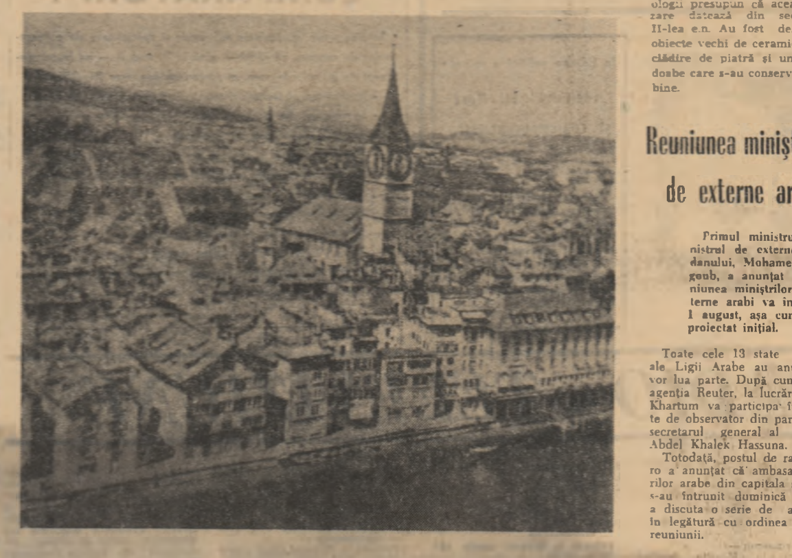
Astăzi este ziua națională a Elveției. În fotografie: vedere din Zürich

Pierderile provocate de puternicul incendiu care a izbucnit la bordul portavionului „Forrestal” se ridică la 60 de militari americani uciși, 78 răniți, iar 112 dați dispăruți, precizează ultimul comunicat oficial al comandamentului militar american. În prezent, menționează agențiile de presă, ritmul operațional de salvare a fost încetinit considerabil deoarece se presupune că cea mai mare parte a militarilor dispăruți au pierit, fie ca urmare a exploziilor, fie s-au înecat. În acest mod, precizează corespondenții agențiilor de presă, numărul morților ar fi de ordinul sutelor. Totodată se menționează că 25 de aparate (în cea mai mare parte bombardiere de vîlătoare cu reacție) au fost complet distruse, iar alte 31 parțial avariate. Comunicatul subliniază că incendiul ar fi fost declanșat de un jet de flăcări izbucnit pe neașteptate dintr-un avion cu reacție. Flăcările s-au extins, ajungînd la depozitele de bombe și muniții, ceea ce a declanșat violența exploziei în lanț.