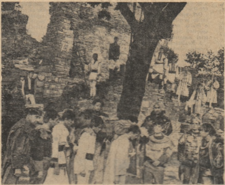
Teatrul în decorul natural al cetății de scaun Suceava.

ION CORNEANU activist al Comitetului raional Ploiești al U.T.C.