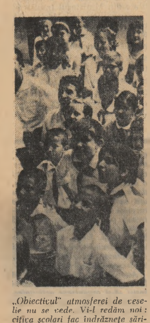
„Obiectivul” atmosferei de veselie nu se vede. Vi-l redăm noi: cîntecul școlarii fac îndrăznele sărituri de la trambulină

GALAȚI (de la corespondentul nostru). Pe porțiunea de cală a Șantierului naval din Galați — destinată lansării la apă a minierașelor — se execută în ritm intens lucrările de montaj la cel de al treilea vas de 12.500 tone. Pînă acum constructorii navali gălațeni au asamblat peste 30 la sută din volumul de elemente ce vor compune nava iar în prezent se montează secțiunea de pupa de la sala mașinilor, suprastructura și prova. Pe cala Șantierului naval din Galați se află în stadii avansate de asamblare și montaj alte două nave de cîte 4.500 tone fiecare.