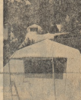
Camping la Mamaia

Unitatea de cofatură nr. 4. O fată elegantă, drăguță, gata să izbucnească în plîns. Părul i-a fost altfel „modelat” de cum o ceruse. Și totuși după ce a schitat manopera, ni bagă în buzunar celei care e servise e hîrtie de 10 lei. — Mi-e rușine să nu-i dau, și sint clientă veche... — Ită! deci că sint cazuri în care chiar și atunci cînd ătu că vor primi, cei obișnuiți cu această practică nu-și fac meseria cum trebuie. Continuăm ancheta. Ne adresăm chiar celor în cauză. — Asta n-l merseria. Frizerul, măcelarul și croitorul nu pot fi dezvățiați de așa ceva. (E. Martin, frizer la unitatea nr. 21 și... responsabil). — Așa ne-au obișnuit clienții.