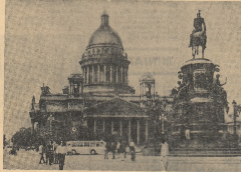
PE SCURT ● PE SCURT ● PE SCURT ● PE SCURT ● PE SCURT ● PE SCURT

„Anuarul feroviar 1967”, apărut în R.F. a Germaniei, arată că rețeaua căilor ferate atinge în întreaga lume lungimea de 1.300.000 km. Pe continent, această cifră se împarte astfel: America de Nord și Centrală — 467 mii km; Asia, — 320 mii km; Europa 290 mii km; America de Sud — 101 mii km; Africa — 76 mii km; Australia și Noua Zeelandă — 46 mii km. În ce privește electrificarea căilor ferate, pe plan mondial procesul acesta este departe de a fi avansat: în întreaga lume sînt electrificate doar linii în lungime de 105 mii km (ceva mai mult de 0,8 la sută din total).