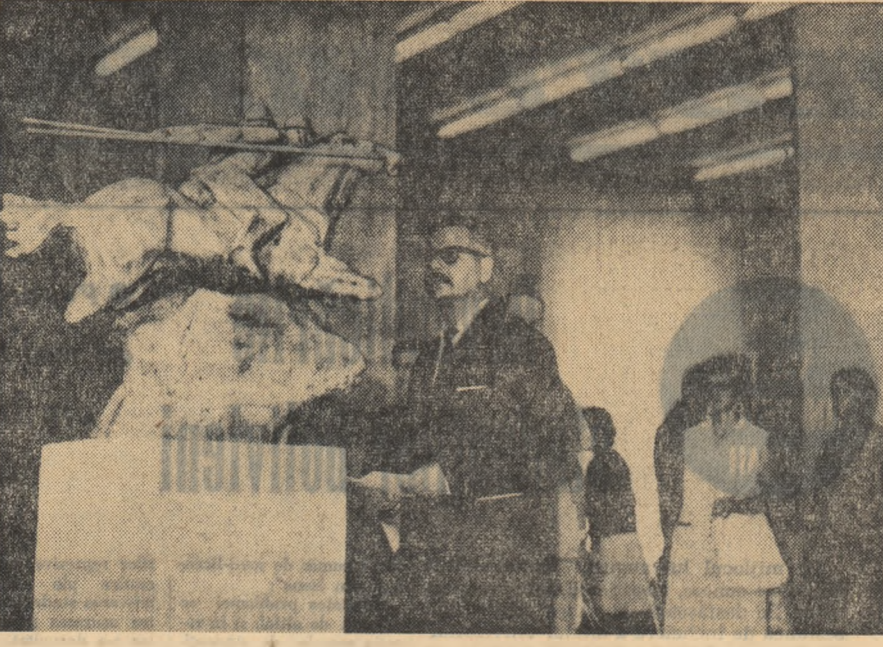
În sălile Muzeului de Artă al Republicii Socialiste România, s-a deschis o expoziție retrospectivă de artă plastică, consacrată împlinirii a 50 de ani de la eroicele bătălii purtate de armata română la Mărășești, Mărăței și Otitur.