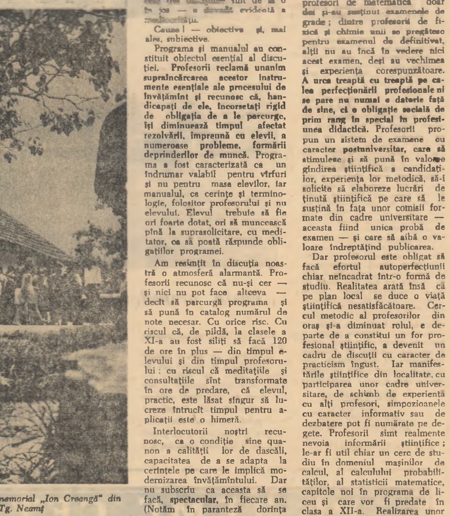
Visitînd Muzeul memorial „Ion Creangă” din Tg. Neamț