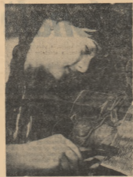
Florești de frumoasă