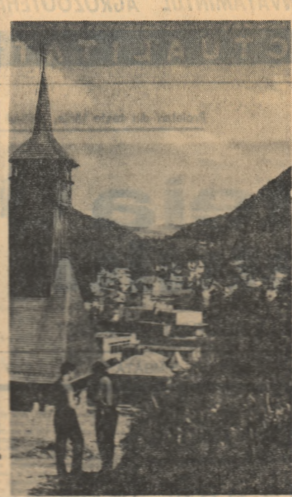
Olănești în august

„Nu se asigură o corelare a diferitelor programe ceea ce afectează conținutul învățămîntului profesional. Dacă s-a acceptat, în sfîrșit, ideea ca profesorii din diferite școli să întocmească programe, ceea ce este foarte bine, nu înțeleg de ce se menține practica elaborării programelor separat, pentru fiecare materie. Asistăm în continuare la situația nefastă în care un colectiv de la un obiect nu știe ce face un alt colectiv, iar în final nu se vede practic că există cineva care să le coreleze, să le sincronizeze pe toate”.