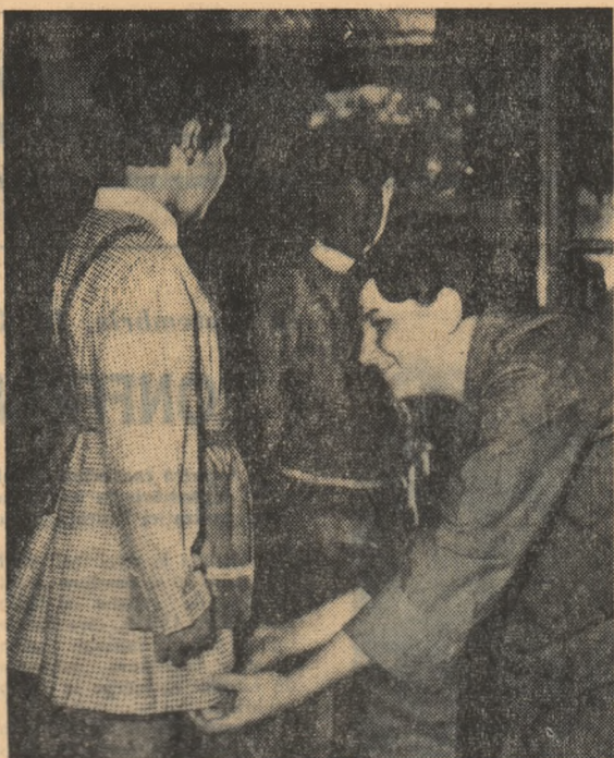
Uniformă pentru noul an școlar

Lucrările noului port maritim Constanța au intrat într-o nouă etapă, marcată de începerea construcției primului chei de acostare a navelor petroliere.