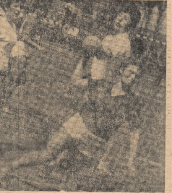
Bine angajat la semicercul ploștului echipei germane va înscrie unul din cele două puncte pentru echipa sa. (Rapid — Lokomotiv Rangsdorf 15—2)