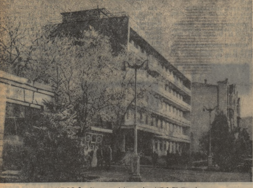
U.R.S.S. În pitoreasca stațiune climaterică Piatigorsk

Ultima aventură a mercenarilor congolezi a început la 3 iulie, exact la trei zile după ce Moise Chombe a fost capturat în Algeria. El s-a răzvrătit împotriva guvernului de la Kinshasa, chipurile, ca să obțină eliberarea mentorului lor Chombe, și un portofoliu de ministru pentru acesta. De fapt, mercenarii încearcă să reediteze alte aventuri ceva mai vechi, singeroase și de tristă amintire pentru congolezi. Aceiași mercenari care controlează acum o parte din orașul Bukavu, l-au sprijinit pe Chombe în zilele venirii lui la putere ca prim ministru săvîrșind crime oribile. Recunoaștor „grupe” verzi de luptă” Chombe le-a dat numele care se vrea onorific de „grupa Leopard” iar pe conducătorul lor, Jean Schramme l-a avansat la gradul de maior. În prezent