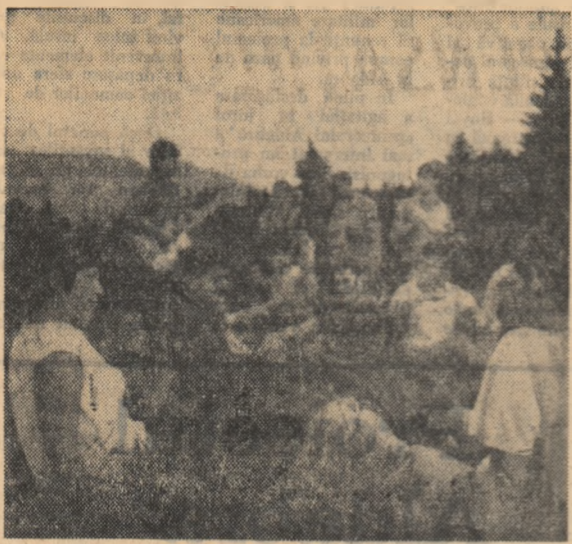
Popas studențesc de cacaoșă în Carpați.

Președintele Comitetului de Stat al Planificării, Maxim Berghianu/ însoțit de un grup de specialiști, a plecat luni la Moscova, unde va avea o convorbire cu N. K. Baibakov, vicepreședintele al Consiliului de Miniștri, președintele Comitetului de Stat al Planificării al U.R.S.S.