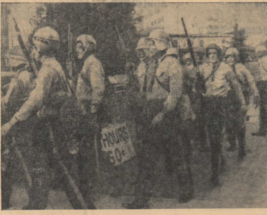
S.U.A. Polițiști din New Haven îndreptându-se spre cartierul negrilor unde recent au fost semnalate tulburări

„Reluarea activității politice, ie agenția France Presse, va fi acest an pentru primul ministru foarte încercată, mai ales pe un intern”. Faptul dominant în stituia recrudescența neliniștare a șomajului, care a atins ra de 555.000 de șomeri. Se vede, ca până în iarnă numărul acestora să ajungă la 750.000 persoane. Aceste cifre snt suioarele previziunilor inițiale ale șcialiștilor guvernamentali. „Este foarte posibil, continuă șeși sursă, ca guvernul Wil-son să ia unele măsuri menite ameliora această situație, în ecial sub forma unei atenuări