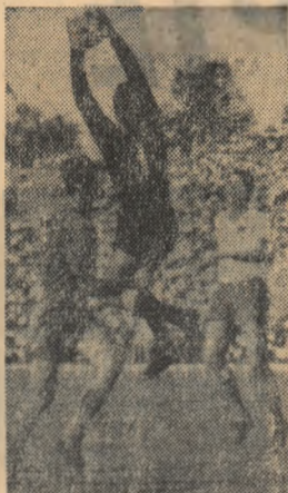
Bay, portarul mureșean, rezolvă cu succes o fază la care Constantin a venit prea tîrziu