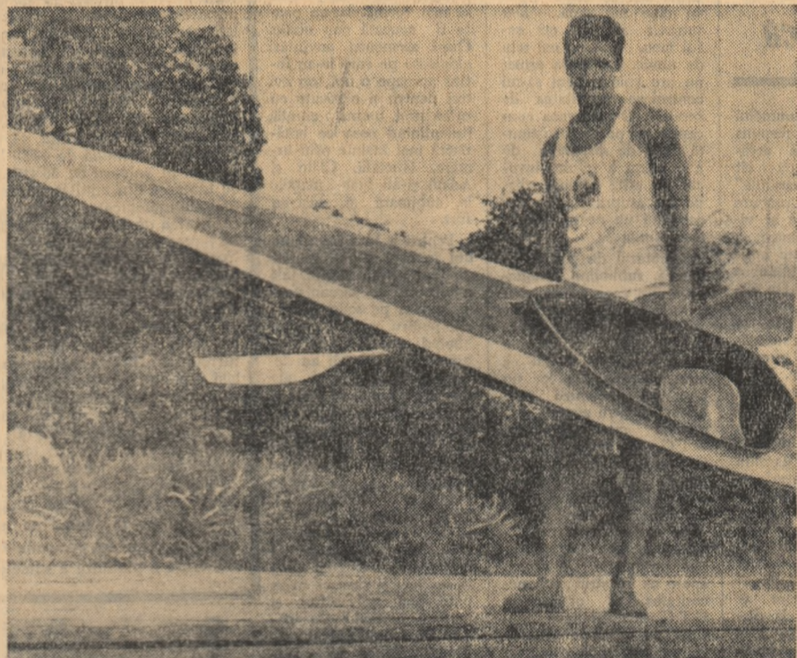
În fruntea listei campionilor europeni se află, așa cum ne-am obișnuit în ultimii ani, maestrul smerit al sportului, Aurel Vernescu