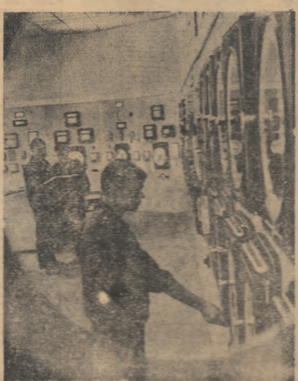
Aspect din secția de amoniac a Combinatului de Ingrășăminte Azotose

„Scinteia tineretului” (Continuare în pag. a II-a)