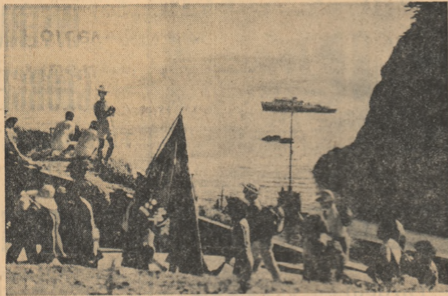
JAPONIA. — Grup de tineri participanți la un marș al păcii, având drept țintă finală insula Niijima. Participanții la marș au ales acest mod de exprimare a voinței lor de pace, de stingere a focurilor de război din Asia