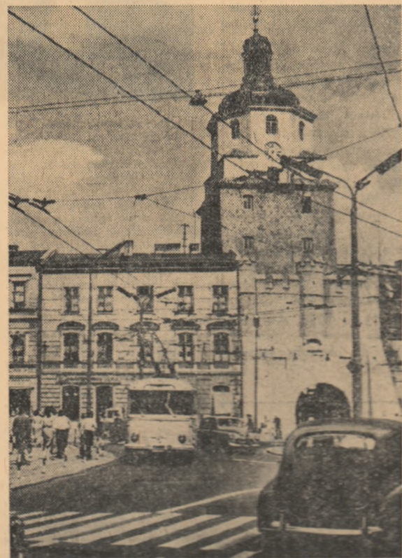
R. P. POLONĂ. — „Poarta cuceririi”, construcție din Leblin datând din sec. XIV-lea