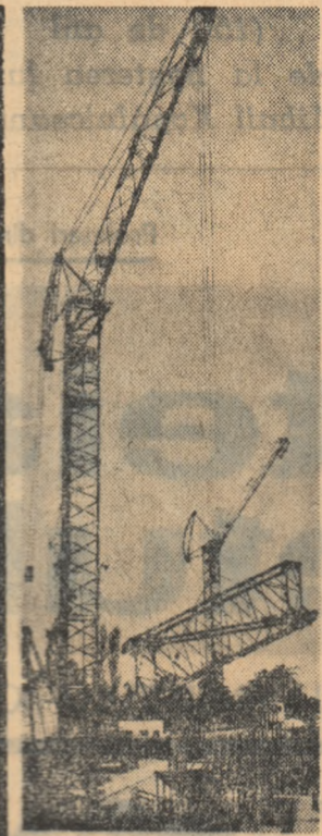
Intreprinderea de construcții metalice și prefabricate din Capitală...