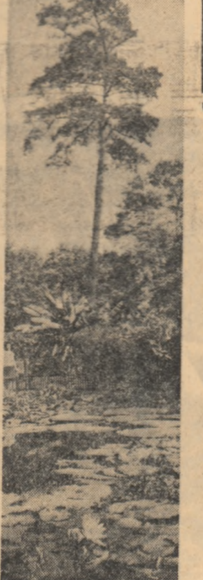
Cunoscutele Băi Felix de lângă Oradea...