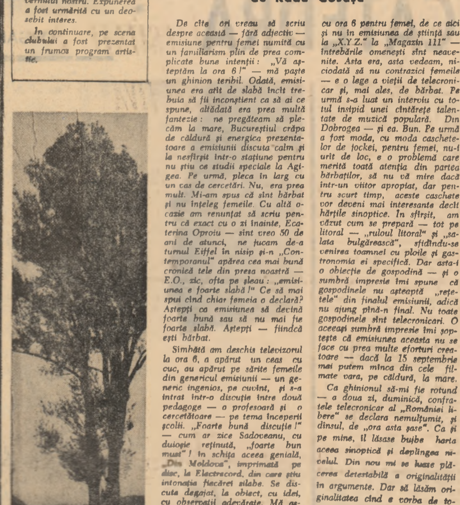
Așezat pe Dunăre