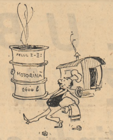
...și să vedeți desertul! Desene de M. CARANFIL