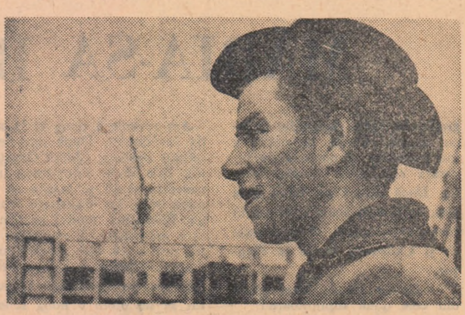
Tinăr de pe șantierul de construcții din Halle-West

de ordin social-edilitar gravate mai ales prin dispersarea pînă acum a forțelor de muncă în innumărate localități rurale și urbane. Numai la Leuna și la Buna salariații de aici locuiau în 250 de sate făcînd naveta zilnică. Problema construcțiilor de locuințe și a rezolvării optime a transportului se insercia deci cu egală importanță alături de continua dezvoltare industrială a regiunii. Încă înainte de a ieși spre vest din mileniul oraș Halle nu se poate să nu vezi marea șantier de la Thälmannplatz unde se construiește, în cadrul unui vast proiect de reconstrucție a centrului orașului, o stradă suspendată, lungă de 350 de metri. Pe agenda turistului se impun imediat construcțiile cărora nu numai localnicii le dau o mare importanță. Și nu numai de ordin imediat, practic, ci și de experiment. Halle-vest, Halle-Neustadt se profilează de cum treci de două borne kilometrice de la limita periferică actuală a orașului. Făra de temelie a fost pusă la 15 iulie 1964 după ce au fost luate în studiu nu mai puțin de 13 variante de amplasare a noului oraș. Prima construcție ata-