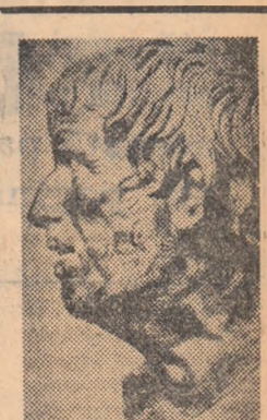
„Mă bucur să învăţ ca să pot învăţa pe alţii”. SENECA

Hoei, cum pot eu să-l mai înţit la un spectacol sau la o discuţie despre situaţia şcolară a fiului său? Începîm să fim con- ştenţi cu oamenii de serviciu...” — mărturisise el cu tristete. Desigur, „dialogul” poa- te continua. Am oferit a- ceste exemple numai pen- tru a-şi cunoaşte potenţa, intensitatea. Un arbitru propune? Oricum, tot pe acolo, pe undeva, prin sfîrşitul forurilor imediat superioare trebuie să existe.