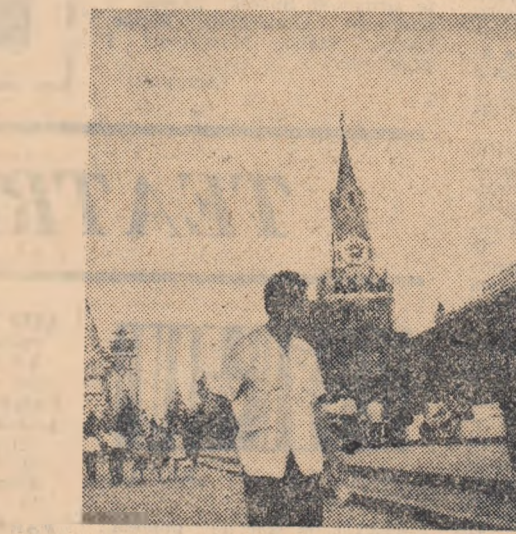
secvență din Piața Roșie.