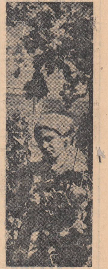
Anotimpul culesului. Struguri din via cooperativă agricolă din comuna Chirnogi, regiunea București, la drumul pietonilor și al cramelor