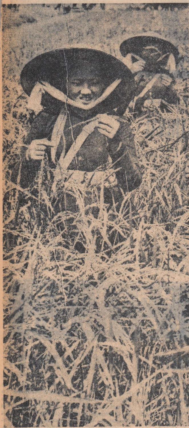
R. D. VIETNAM. Membri ai cooperativei din Hona Hong în lărul de orez.