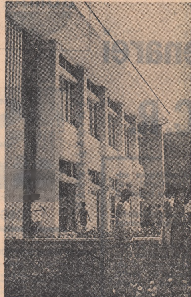
În fața casei de cultură a sindicatelor din Piatra Neamț