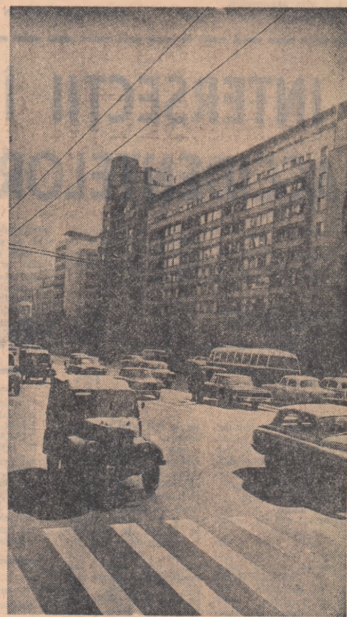
Circulație intensă în centrul Capitaliei