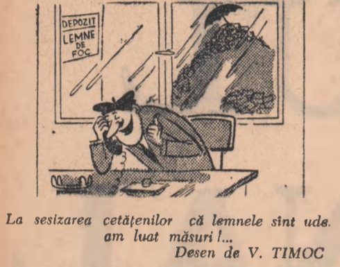
La sesizarea cetățenilor că lemnele sînt ude, am luat măsuri!... Desen de V. TIMOC