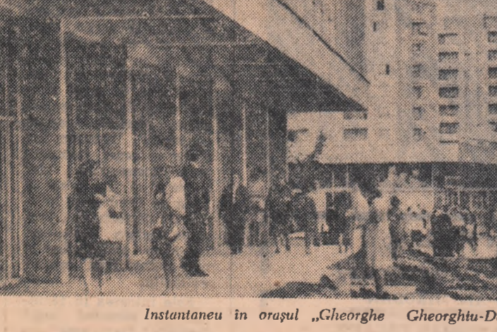
Instantaneu în orașul „Gheorghe Gheorghiu-Dei”

Consider, înainte de toate, că învățămîntul profesional s-ar putea mult îmbunătăți dacă se va acorda o importanță mai mare, în primul rînd, față de materialele didactice. În acest sens, mă gîndesc că orele de tehnologia