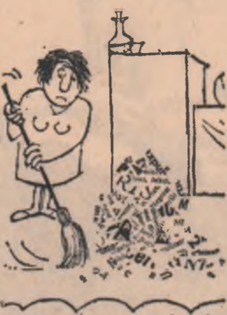
După unele ședințe Desen de C. CIOSU

De atunci au trecut oțeva săptămîni, așfel că acestea oribile îmi jignesc privirea la fiecare pas, Mimi culge în continuare aplauze furtivoase, iar eu, care știu că se poate întimpla o nenorocire, stau în fiecare seară ascuns într-un colț și tremur pentru o vedetă.