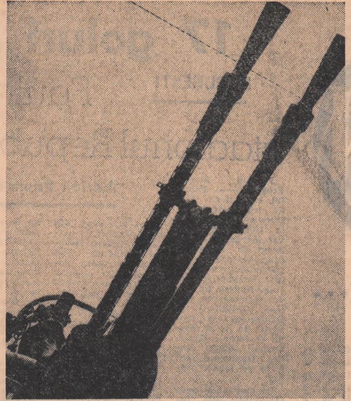
De straia Hanouului

La rîndul său, „CHRISTIAN SCIENCE MONITOR” menționează că „pierderile de vieți omenești i-au făcut