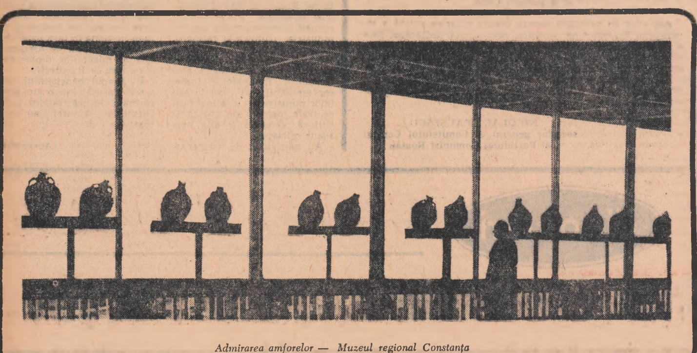
Admirarea amforelor — Muzeul regional Constanța

mașinilor agricole, al mașinilor textile, al lagărelor pentru laminare ș. a. Fără îndoială că nu se poate vorbi de construirea pe scară largă a organelor de mașini din materiale plastice, fără o experimentare atență a lor în condițiile reale de funcționare, sprînjinită de o investigație științifică a problemelor aferente cu caracterul lor de generalitate și cu considerarea influențelor izvoarte din diversitatea condițiilor funcționale. Asemenea probleme oferă în prezent un câmp larg de cercetare și formează obiectul unor preocupări științifice în țara noastră, și pe plan mondial.