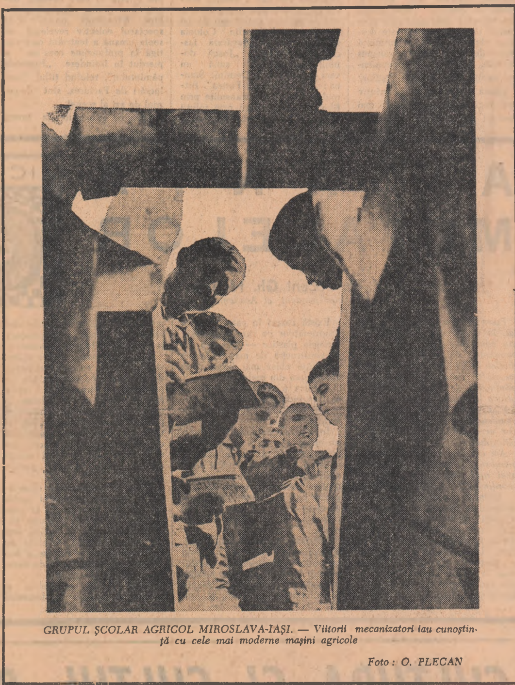
GRUPUL ȘCOLAR AGRICOL MIROSLAVA-IAȘI. — Viitorii mecanizatori sau cunoștință cu cele mai moderne mașini agricole