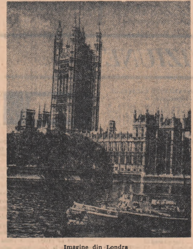
Imagine din Londra

cunoaște sub conducerea magistrală a coregrafului britanic Jack Carter o versiune nouă, neașteptat de interesantă, de modernă în sensurile profunde ale cuvîntului. Cuplul Odette-Odile a fost desăfuit, căpătînd sensuri în interpretarea a doi balerini diferiți. Imaginația creatoare a artiștilor londonezi aveam s-o aflăm și la Haughton Court, unde un ta-