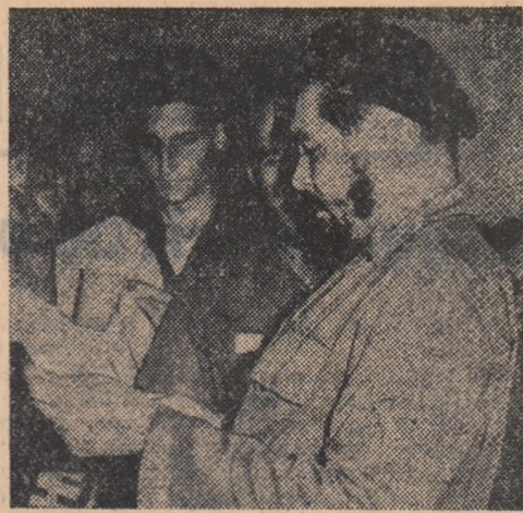
ERNESTO GUEVARA în anul 1962 în mijlocul unor tineri muncitori din provincia Havana.

După victoria revoluției cubane, lui Ernesto Guevara i s-au încredințat funcții de răspundere în domeniul hotărîtoare pentru dezvoltarea Cubei pe calea construcției socialiste. Di-