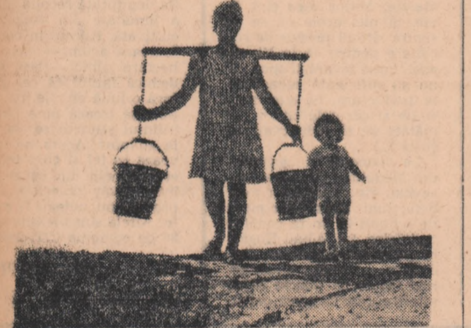
„Ajutor” prețios dat mamei...