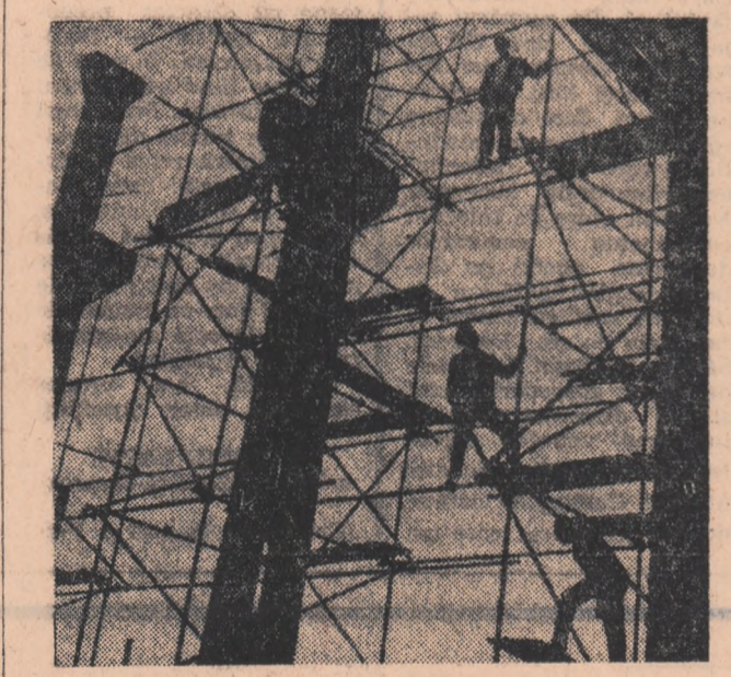
Pe șantierul de extindere al Fabricii de geamuri din Scăieni