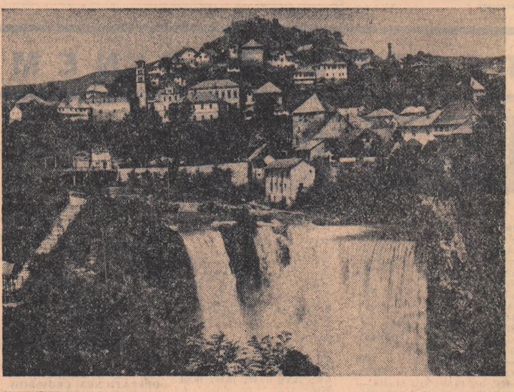
R. S. F. IUGOSLAVIA. — Localitatea Jajce și cascadele Pliva, unul din cele mai atractive locuri din Bosnia