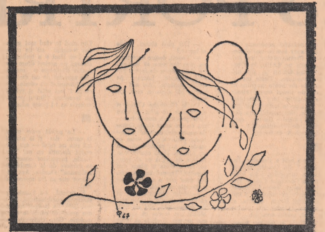
Desen de DORIN DIMITRIU