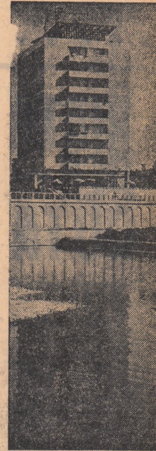
Crîșul întilnește Oradea.

Un colectiv de specialiști de la Fabrica de postav din Buhuși a realizat pentru prima dată în țară, fire fabricate din fibre polipropilenice.