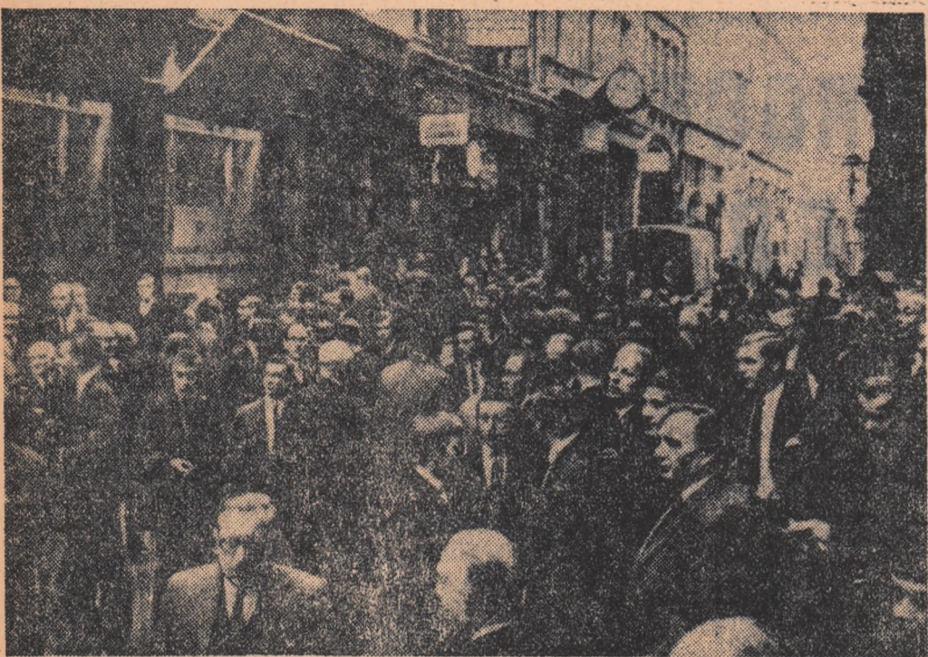
ANGLIA. — Pe străzile Londrei, imediat după devalorizarea lirei sterline