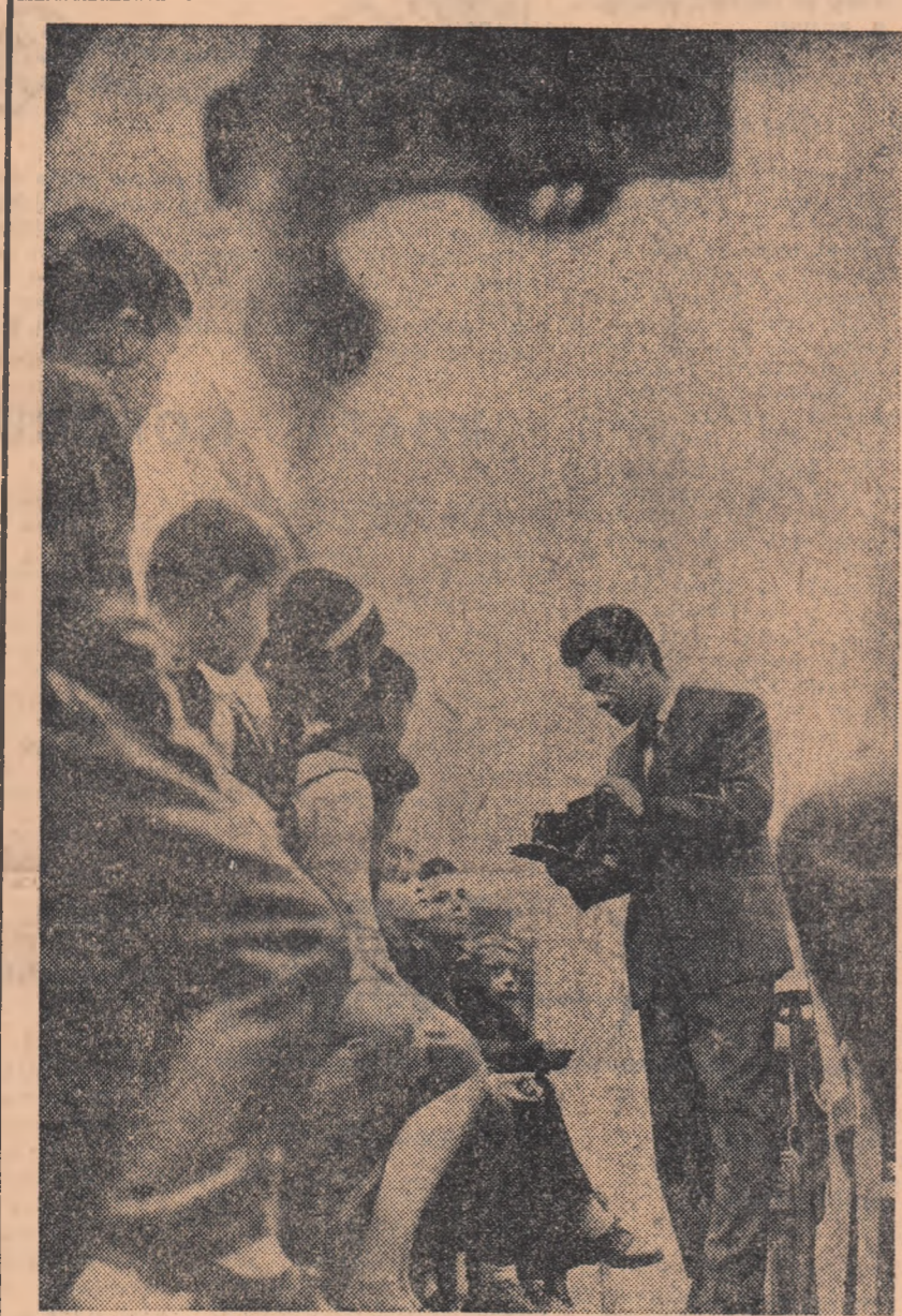
Care elevii fascinați acum în fața „ochiului magic” al aparatului de fotografiat vor deveni, peste ani, pasionați și pricepuți foto-amatori?... Depinde de talentul și străduința lor, dar și de competența instructorului.

Construcții și energeticieni de la IREM-Tg. Mureș și I.E.M.-Cluj au îndeplinit planul anual de construcții și montaj cu 40 de zile înainte de termen.