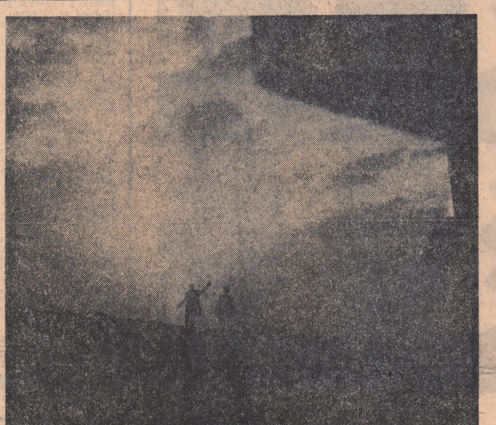
Două fotografii de ION CUCU