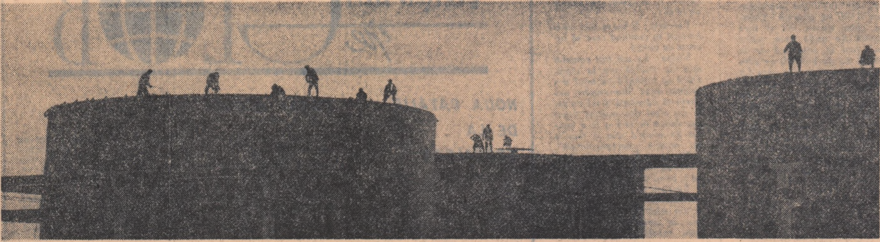
Șantierul 4 - Rafinării Pitești: La înălțime, se lucrează la parcul de rezervoare al noii rafinării

Cu acest prilej, „Sciinteia tineretului” organizează un CONCURS dotat cu PREMII pentru cele mai bune VERSURI DEDICATE PAȚRIEI, scrise de cititorii ziarului. Lucrările vor fi trimise până la 20 decembrie a.c. pe adresa: „Sciinteia tineretului”, Piața Șciinteii, nr. 1.