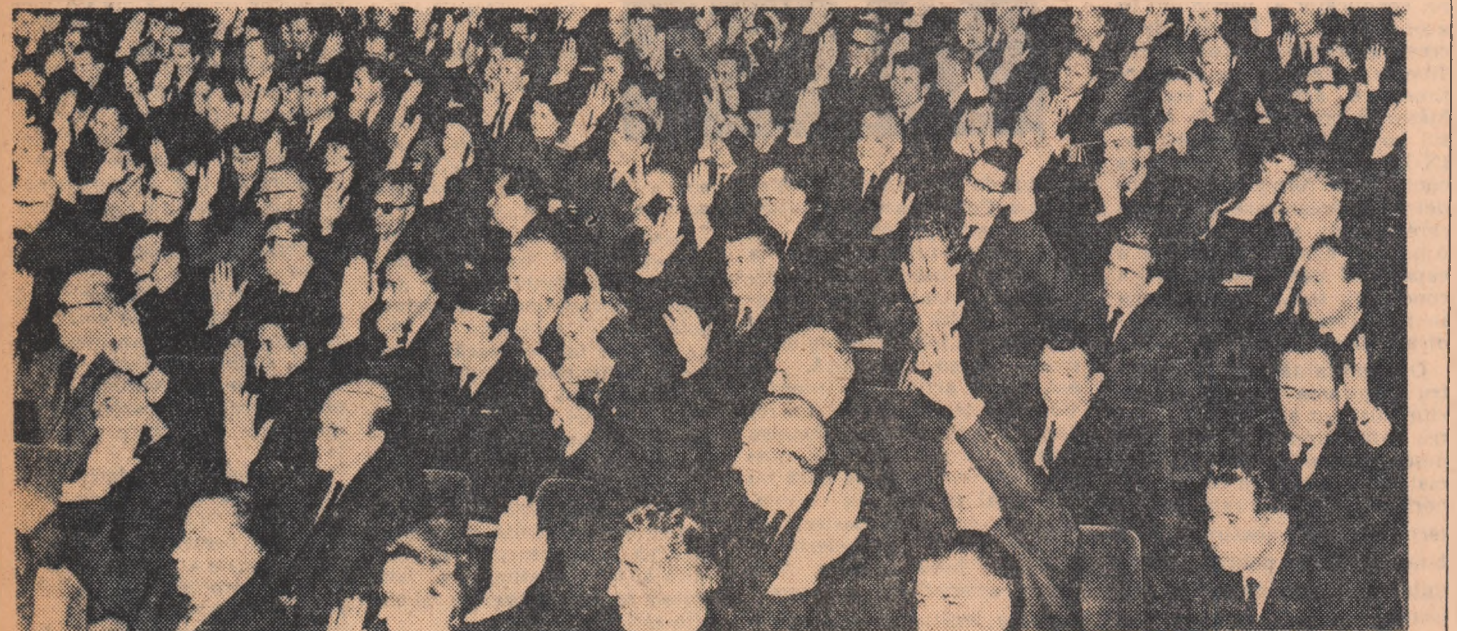
Delegații adoptă în unanimitate Rezoluția Conferinței Naționale a Partidului Comunist Român