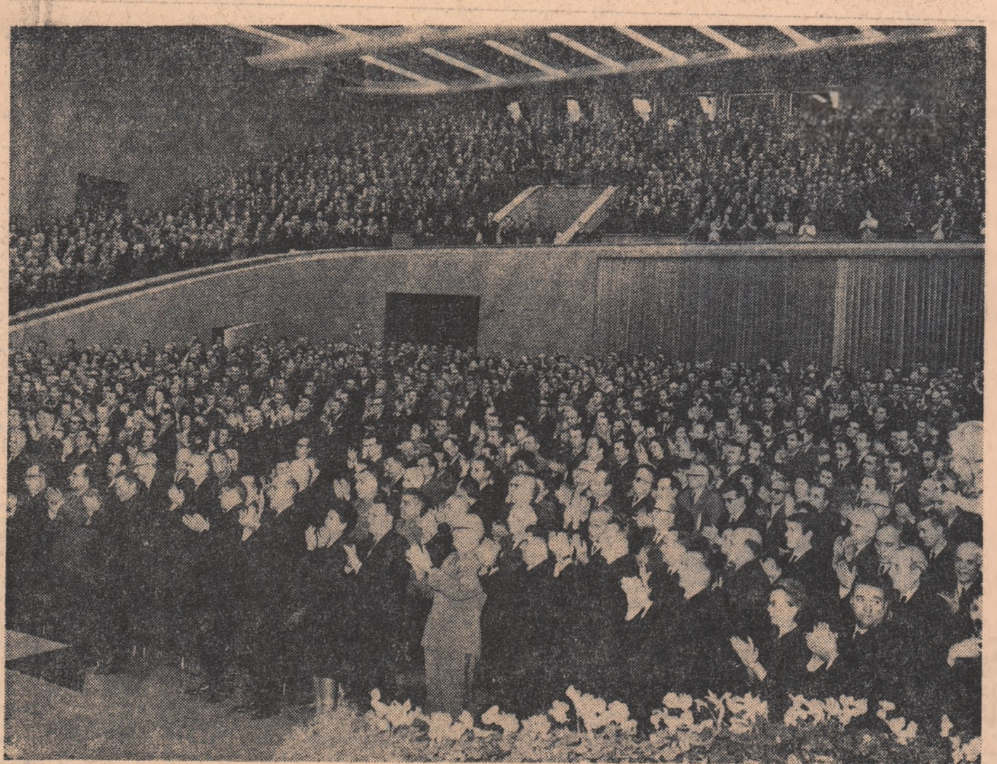
Într-o atmosferă de mare entuziasm, lucrările Conferinței au sfîrșit

Îmi dau seama, tovarăși, că îndeplinirea în bune condiții a sarcinilor încredințate de partid, a acestei încercări de mare răspundere poate fi realizată numai apîndu-se cu fermitate și întîrînd continuu principiul muncii colective, numai prin participarea activă la rezolvarea tuturor problemelor a fiecărui tovarăș din conducerea de partid și de stat, prin adunerea în întreaga muncă a activului nostru, a tuturor comunistilor, a întregului popor. (Aplauze). Vă asigur, tovarăși, că nu voi precepeți nici un efort pentru îndeplinirea îndatoririlor încredințate de partid și popor, pentru a contribui la înfăptuirea neabătută a tuturor hotărîrilor partidului, pentru înflorirea continuă a patriei noastre, pentru fericirea poporului român, pentru cauza socialismului și păcii. (Vii și puternice aplauze). Vă urez, dv., tuturor delegaților și invitaților și, prin dv., tuturor comunistilor, tuturor oamenilor muncii, noi și mari succese în îndeplinirea hotărîrilor Conferinței noastre, a hotărîrilor Congresului al IX-lea al partidului, în slujba scumpei noastre patrii — România socialistă. (Întreaga asistență se ridică în picioare. Răsună îndelung aplauze și urale).