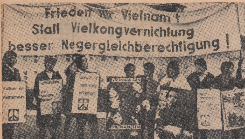
Cetățeni din Göttingen R.F.G. au participat zilele trecute la o demonstrație cerind încetarea intervenției S.U.A. în Vietnam.