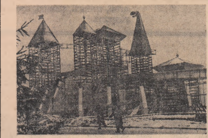
Se pregătește celata din Piața Scintei

Cei ce trec pe lângă Pavilionul Expoziției Economiei Naționale au descoperit, probabil, o apariție ciudață: un „cocos de tablă în vârful unui turn”. E turnul „Palatului de cleștar”. E vorba de o nouă expoziție? Intr-o fel de... a fost total neglijată. Clasa a XI-a F cere o districție, cu catalogul în față, acum, și nu în trimestrul al III-lea. Se pare că, aici, în clasă, activitatea abia trebuie să înceapă, evident, cu prima literă a alfabetului muncii școlare: dezvoltarea răspunderii față de învățare, pentru că toți să-și vătorează exact îndatoririle de elevi. Aceasta nu se poate face într-un colectiv nesudat și, mai ales, nu se va realiza cu rezultatele scontate dacă se va aștepta în continuare umplerea catalogului cu note slabe după care să se discute și să se analizeze situația concretă. În clasă sint de pe acum destul de mulți corijenți la conștiințozitate și disciplină de care colegii, organizația U.T.C. împreună cu tovarășii diriginte trebuie să-i ajute să le treacă a-acum cu bine, iar trimestrele următoare folosite pentru o activitate școlară susținută.