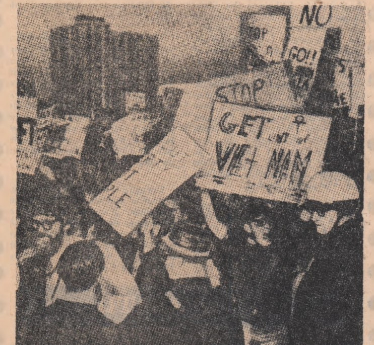
Demonstrație în S.U.A. împotriva războiului agresiv din Vietnam