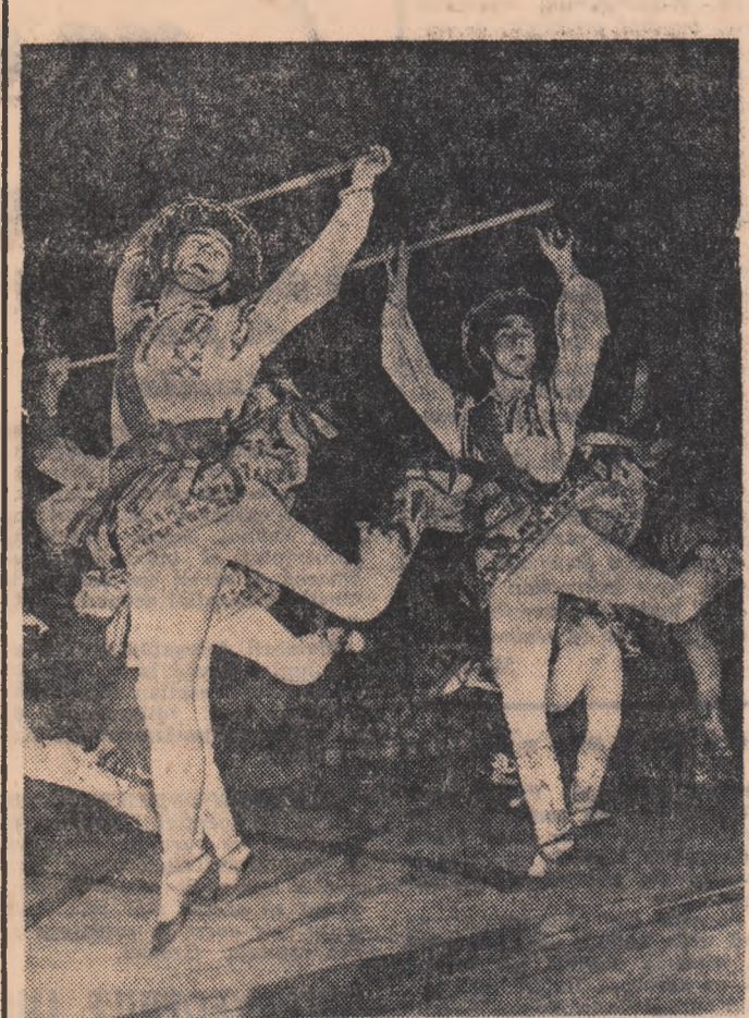
Dansul călușarilor în interpe țarea Ansamblului „Ciocirlia”