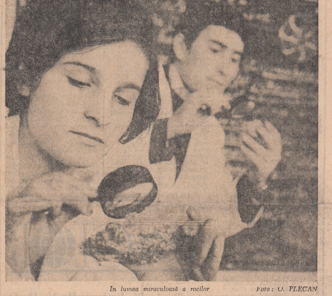
In lumea miraculoasă a rocilor

Relația scriitor-cititor, eveniment pentru ambele părți Răspunde ADRIAN PĂUNESCU secretar al organizației U.T.C. a Uniunii Scriitorilor 1. Ce ar trebui să exprime înțelirile scriitorilor tineri cu cititorii? 2. Ce propuneri poate face organizația U.T.C. a Uniunii Scriitorilor pentru stimularea acestor sczătorii literare? 3. Stratificarea publicului e un fenomen general? E un proces foarte accentuat în rîndul tineretului? Ce concluzii de ordin practic se pot trage de aici, privind variațiile sczătorilor de care vorbim? 4. Ce considerați că trebuie să știe cadrele U.T.C. pentru ca munca de educație, de toate felurile, să fie reală? 1. Înțelirea scriitorului — tînr sau nu — cu cititorul — tînr sau nu — este înțelirea unei entități cu sine însăși. Căci, la urma urmei, cititorul, adevăratul cititor, este un scriitor cu mîna oprîntă, un scriitor excesiv de timid, un autor care acceptă mai degrabă să-și asume ce au scris alții, decît să scrie el. Un mare cititor (folosec cuvîntul „mare” cu valoarea pe care o are atunci cînd se află pe lîngă cuvîntul „scriitor”) va fi fiind probabil autorul straniu al comperajului unei părți din „Doamna Bovary”, cu o parte din „Craii de Curtea Veche”, cu o parte din „Elegiile din Duino”. Un mare cititor este acela care lipsește una de alta părți ale unor structuri, în măsura în care convin structurilor sale. Cartea „scrisă” de acest mare cititor este formată din (Continuare în pag. a III-a)