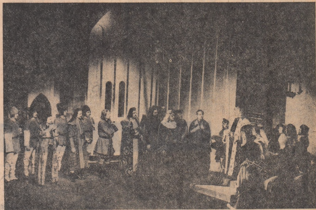
În timpul spectacolului cu „Apus de soare”