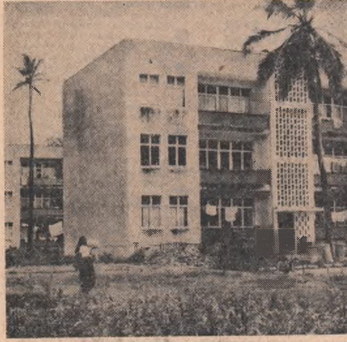
Construcții noi în Zanzibar

CAMERA inferioară a Parlamentului olandez a adoptat cu o majoritate covârșitoare de voturi o rezoluție în care guvernul olandez este chemat să inițieze negocieri în vederea încheierii unor acorduri între cei cinci parteneri ai Franței din C.E.E. și Marea Britanie, care să aibă drept scop realizarea unor noi forme de cooperare. În rezoluție se subliniază că la aceste tratative trebuie să participe, de asemenea, Danemarca, Norvegia și Irlanda. Noile acorduri de cooperare care s-ar putea realiza între țările amintite, menționează rezoluția, ar fi deschise tuturor țărilor.