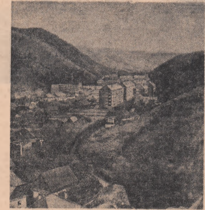
Iată și o imagine a orașelului mîner Bălan