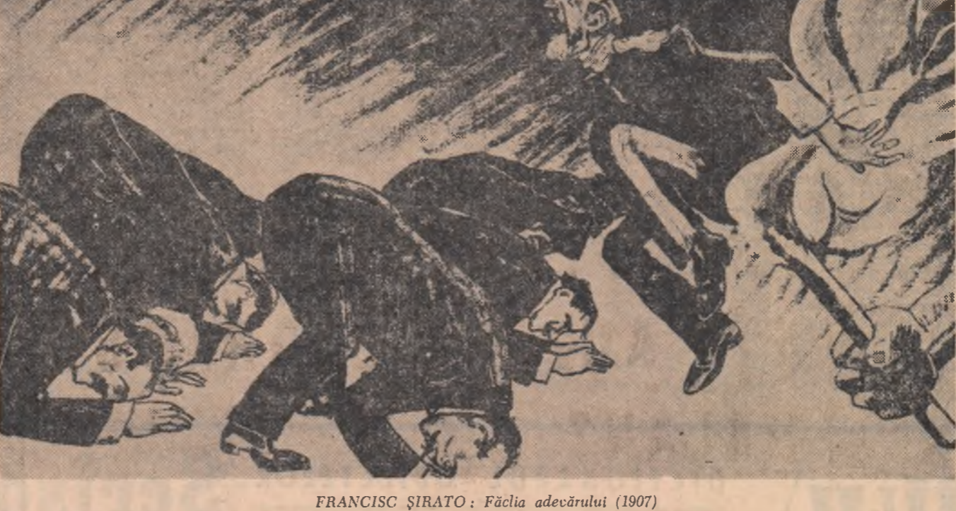
FRANCISC ȘIRATO: Făclia adevărului (1907)

Piesa „Adio, Majestate”, pornind de la un eveniment cunoscut — noaptea de 30 Decembrie 1947, caută să prezinte destinele și gândirea unor intelectuali români — consecvenți luptători antimonarhici. Acțiunea e încorporată într-o singură seară din 1947, dar manevrează diateze ale trecutului ajungînd pînă la 1887. Deci un fel de montaj de secvențe centrate în jurul nopții de 30 Decembrie. Dintre personajele piesei fac parte și junimistul Gheorghe Panu, ilustrul ziarist N. D. Cocea și alții.