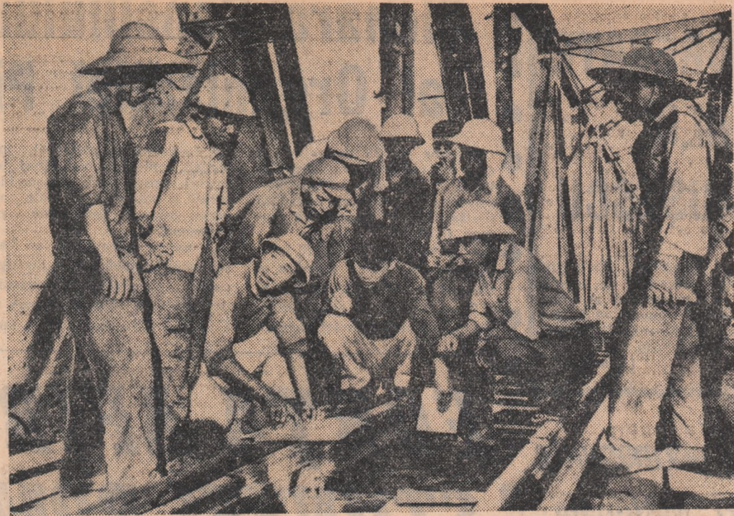
R. D. VIETNAM. — O echipă de intervenție lucind la repararea unui pod bombardat de aviația americană