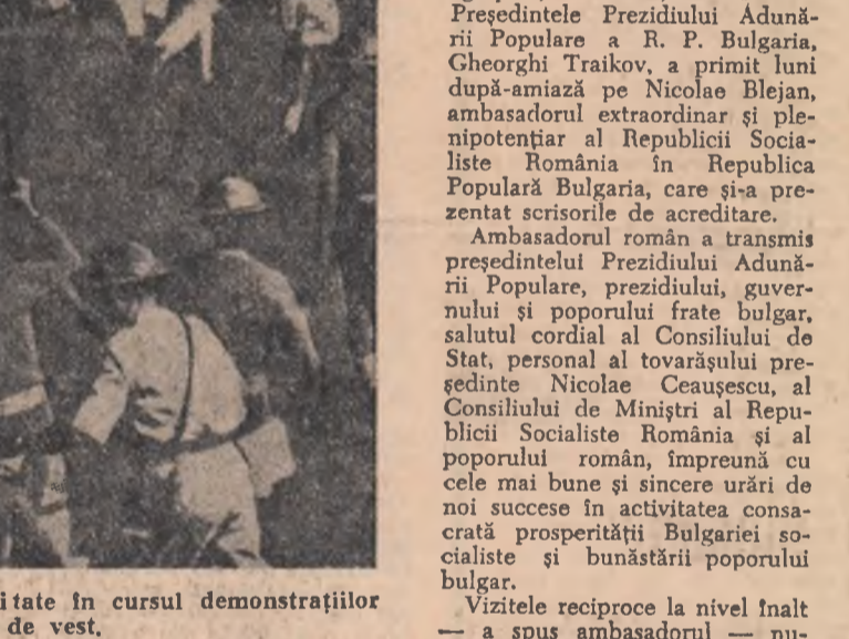
Poliția intervenind cu brutalitate în cursul demonstrațiilor din Bengalul de vest.