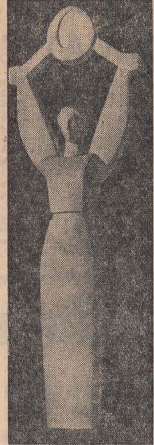
„REPUBLICA” de Gh. Coman (din Expoziția regională Ploiești 1967)