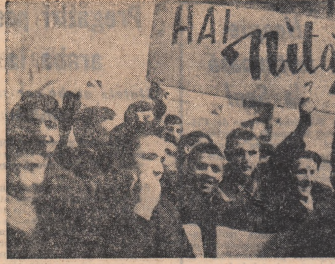
...și Niță a leșit pe locul IV.