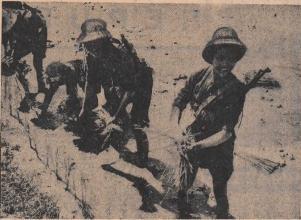
R. D. VIETNAM: În pofida bombardamentelor americane la Hoang Hong continuă lucrul pe plantațiile de orez.