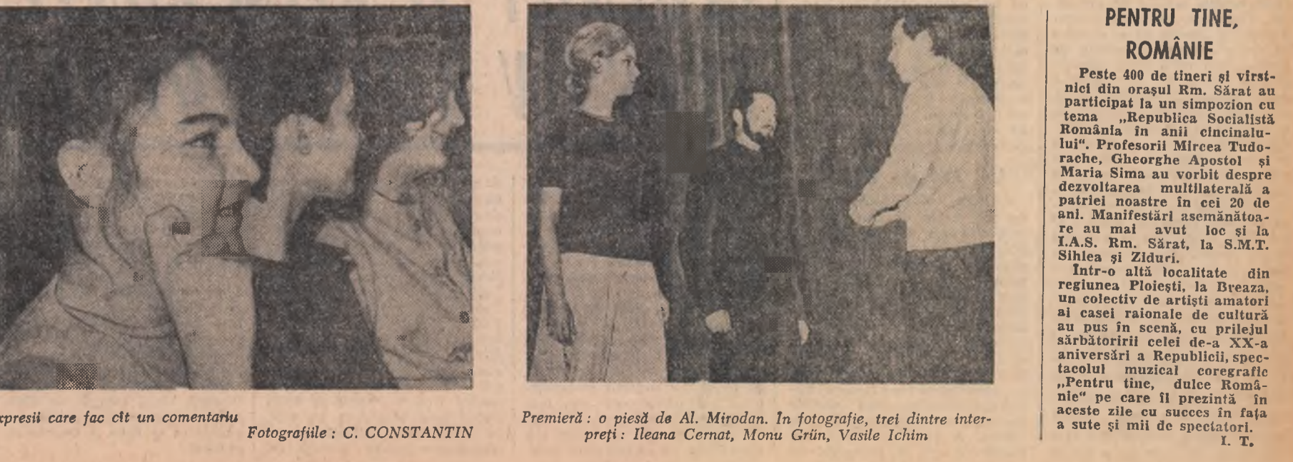
Expresii care fac cit un comentariu