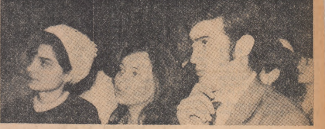
Poezii premiate la concursul celei de-a V-a ediții

Balada De sărbătoare Vine zimbrul din veac Cu luna în coarne Pe drum de cărbune și griu, Gonit de puterea luminii La porțile înalte de aur Apoi se risipește în arbori Să urce cu fructele-n numele zeilor