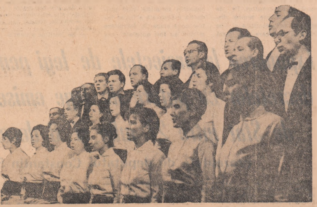
Un moment al Serii: corul Conservatorului „Ciprian Porumbescu” prezintă un grupaj de cîntece patriotice