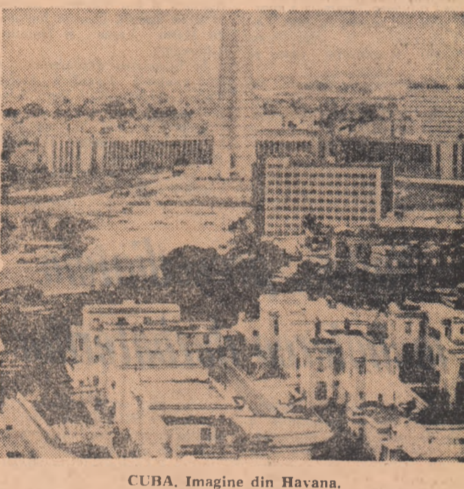
CUBA. Imagine din Havana.