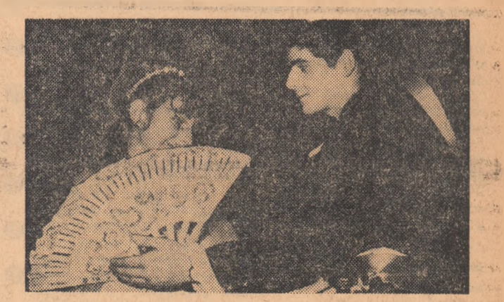
O vreme, capriciile naturii au provocat oarecari emoții organizatorilor acestui minunat episod de vacanță școlară — Comitetul organizatorilor București al U.T.C. în colaborare cu Casa de cultură a tineretului din raionul Tudor Vladimirescu. Absența zăpezii, zile în șir, amenința să transforme mult așteptata petrecere de iarnă în elevilor bucureșteni într-o... metaforă (bine înțeles numai în ce privește neaua!). Dar ieri, în Capitală, a nins în sfârșit din belșug, parcă anume, chiar în prima zi a carnavalului și totul a decurs ca în proiect, spre satisfacția celor 1.000 de invitați: veselie, cântec, dans, surprize, jocuri distractive... zăpadă.