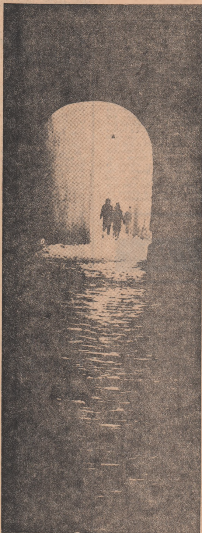
În lumina pașii murmură ca apele, împreună merg împotriva valurilor

VA FI 1968 ANUL REVIRIMENTULUI CINEMATOGRAFIEI NOASTRE?