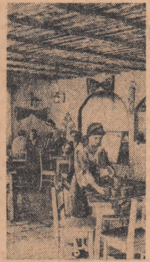
Un vin moldovenesc băut cu „Ocau lui Cuza“