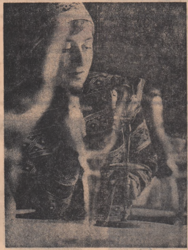
Sculptură în cristal