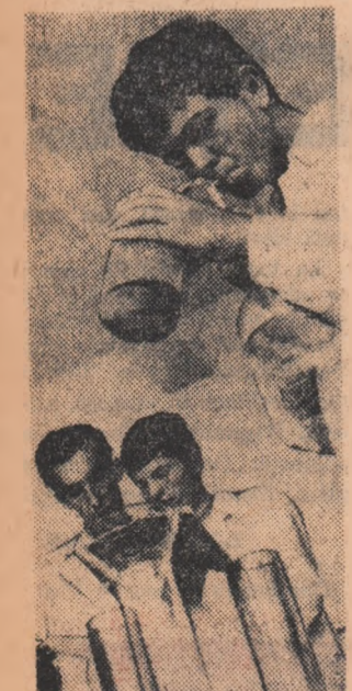
Astăzi elevi, mine tehnicieni ai industriei chimice

Am înțeles în uzină tinerii veniți cu două trei ore înainte de începerea schimbului doi și le era jenă să mărturisescă că programul cantinei îi obligă la un asemenea efort. Dacă organizatorilor nu le este jenă să-i frustreze de atîtea ore libere, noi nu avem reticențe. 200 de muncitori din schimbul doi nu pot beneficia de programul cantinei deoarece fătălăntă i-a închinat între aceste ore.