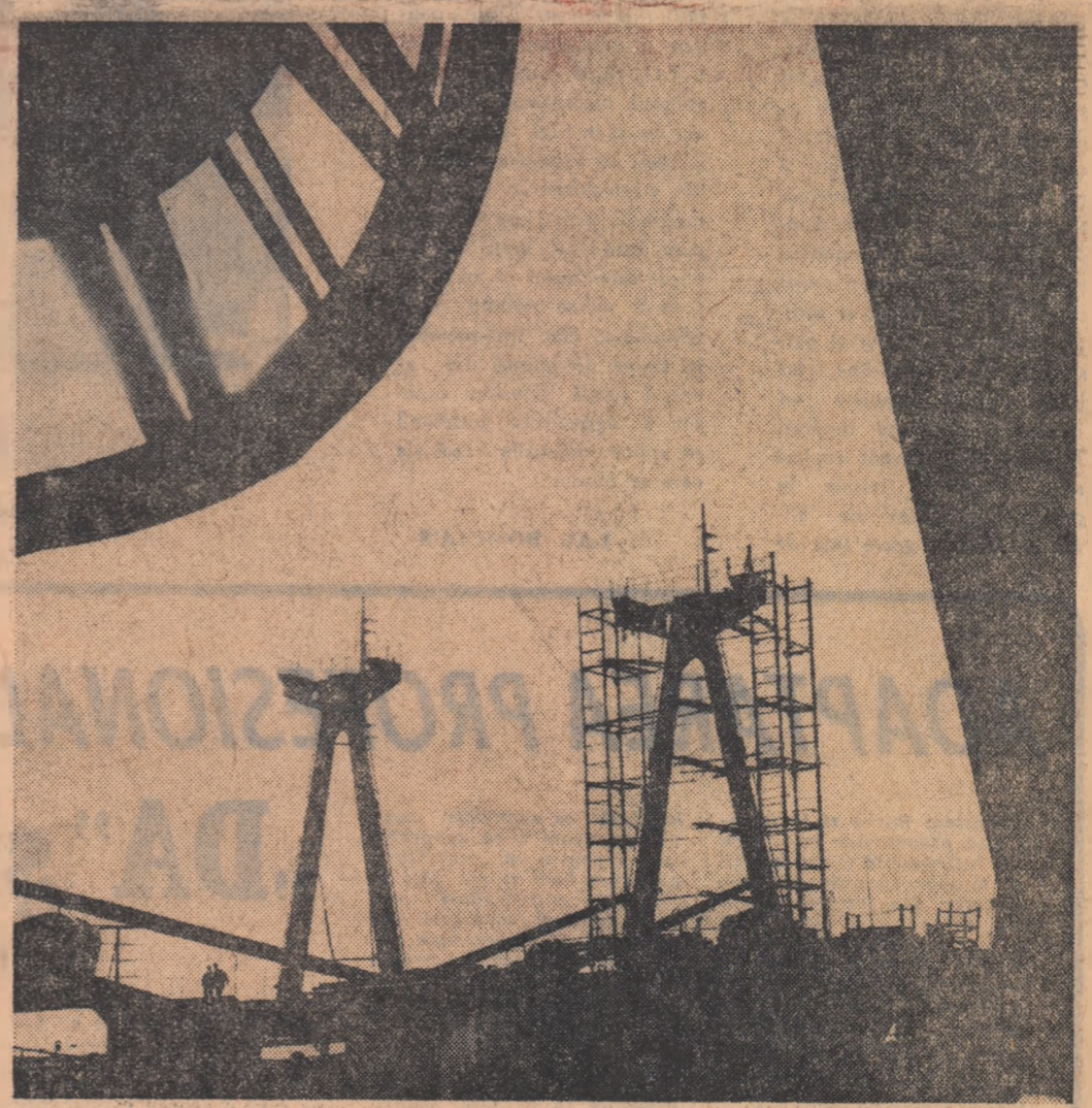
Șantierul naval Galați — Situate în amurg

• ACTUALITATEA — consacrată cărții, scenei, ecranului, șevaletului, partiturii. • REPORTAJE ȘI FOTO-REPORTAJE. O pagină bogat ilustrată în care veți face cunoștință cu... • INTERVIU ÎN CUȘCA CU LEI. Amănunte despre peripețiile reporterului veți afla după lectura reportajului. • ARHIVĂ SECRETĂ. Un episod captivant petrecut către sfîrșitul celui de al II-lea război mondial: descoperirea stenogramelor lui Hitler.