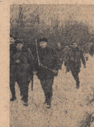
Dacă ați fi pe aproape ați auzi că se poate vîna și ce nu există!