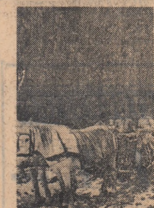
De data asta să știți că nu „poveste”...

Duminică aceasta s-a închis în mod oficial sezonul de vînatore la iepuri. Urechiații care au scăpat de atunci încocoace de „cătără” vînatorelor se pot declara norocoși. Le urăm totuși picior sprinten ca să ducă o viață tihnită în pădure.